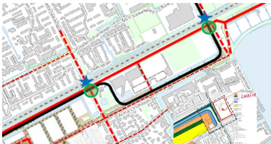
Afbeelding 1.1. Ongelijkvloerse kruising Beneluxlaan ter hoogte van Cattenbroekertunnel en trace (snel)fietsroute in oostelijke richting (tussen Minkema/sportvelden en spoor) naar Harmelen.