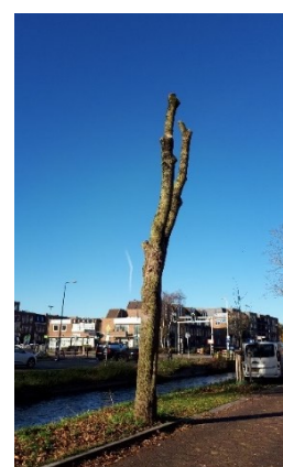
Figuur 2: Veiliggestelde boom

Om het financieel tekort zo klein mogelijk te houden maar wel de veiligheid te waarborgen is het noodzakelijk geweest om dit najaar niet alle dode en gevaarlijke bomen te verwijderen maar waar mogelijk alleen veilig te stellen. Het veiligstellen houdt concreet in dat bij bomen die normaal verwijderd zouden worden nu alle takken worden afgezaagd en dat daarmee een kale stam blijft staan, Figuur 2. Waar dit echt niet anders kon is de boom wel direct verwijderd. Het bepalen van deze maatregelen gebeurt op basis van boomveiligheidscontroles, uitgevoerd door gecertificeerd personeel.