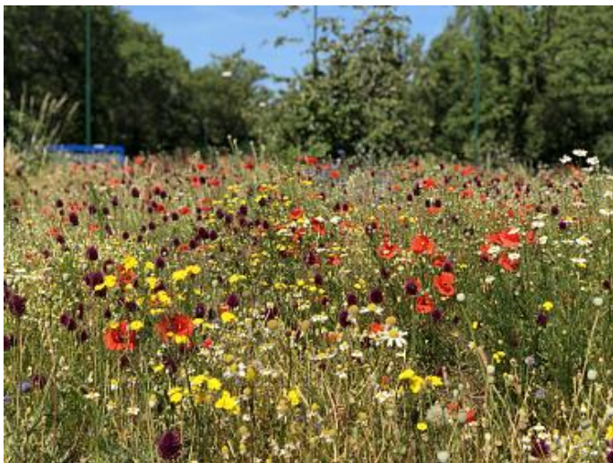
Bonte berm ter illustratie

De berm langs de Oostdam wordt ingezaaid met een bont mengsel van bollen en grassen. Dit om een kleurrijke berm te creëren, goed voor de ecologie en een fraaie entree van het centrum.