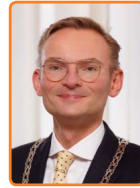
Laren, N. Mol