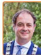
Leusden, G. Bouwmeester