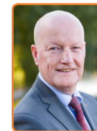
Bunnik, R. van Bennekom