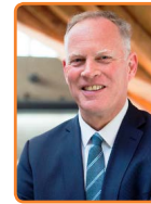
Gooise Meren, H. ter Heegde