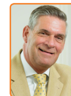
Utrechtse Heuvelrug, G. Naafs