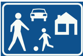
Afbeelding 1 verkeersbord G5, Erf

Heeft u naar aanleiding van deze brief nog vragen? U kunt mij bereiken via het telefoonnummer van de gemeente [...].