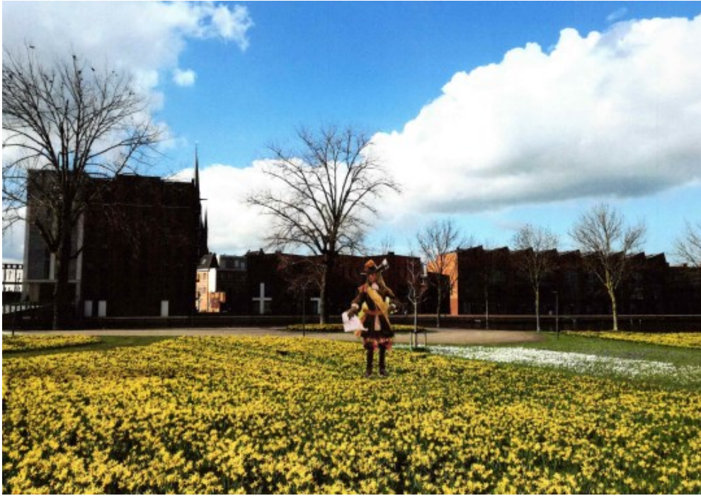
Het Singelpark tegenover het Defentie-Eiland is een passende locatie voor een standbeeld van de Prins, Redder in het Rampjaar.