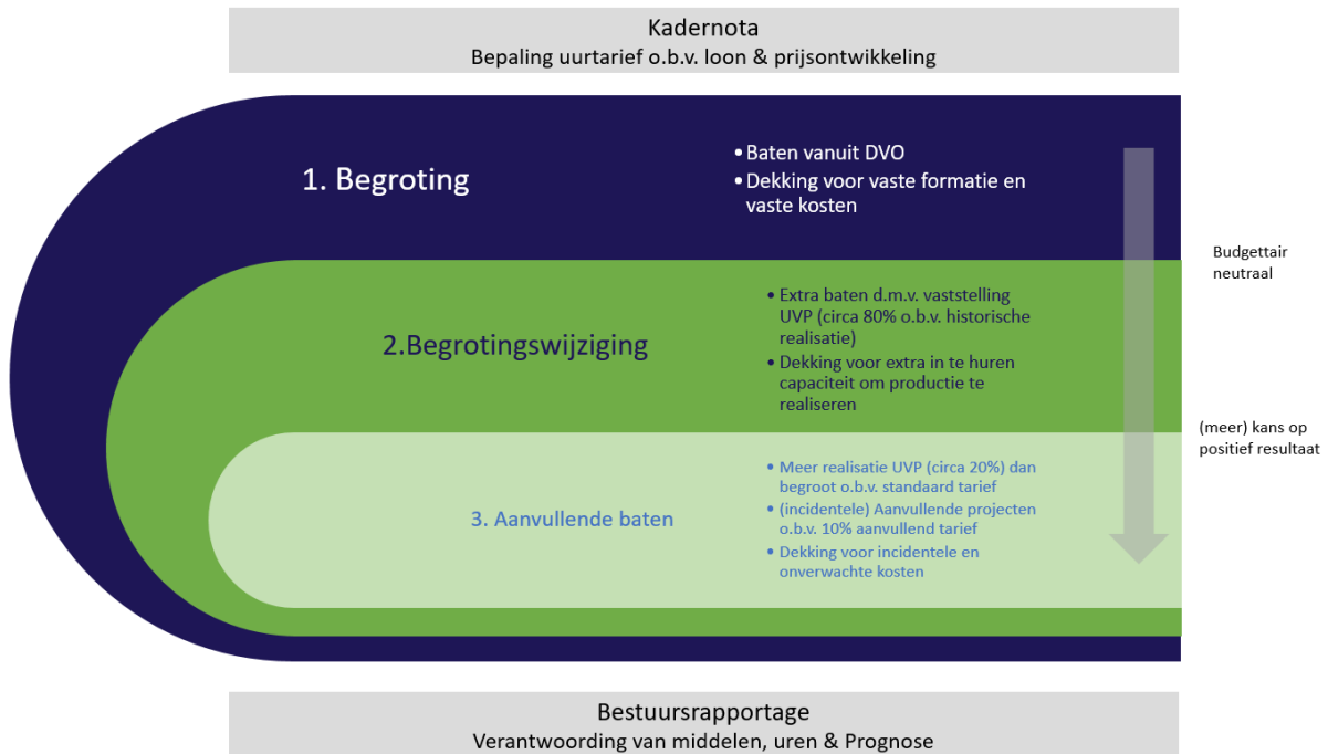
FIGUUR 2: BEGROTINGSMETHODIEK BIJ DE ODRU

Figuur 2 geeft de systematiek van begroten grafisch weer.