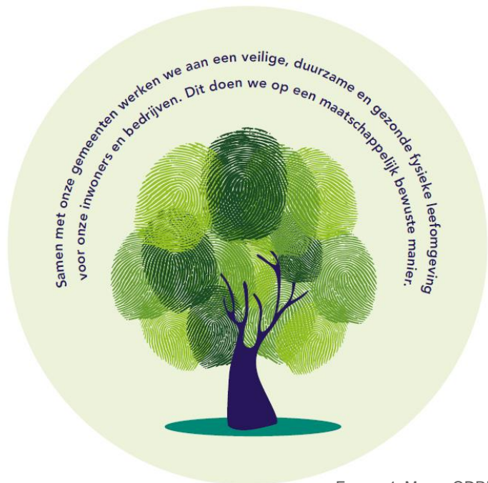
FIGUUR 1: MISSIE ODRU