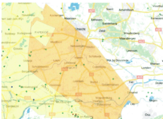
Figuur 1: ligging Opsporingsvergunning Utrecht (oranje)

(zie figuur 1). De Opsporingsvergunning Utrecht staat los van de winningsvergunning voor het Papekopveld. Het gebied van de winningsvergunning Papekopveld bij Woerden behoort dan ook niet tot het gebied van de Opsporingsvergunning Utrecht. De rest van de gemeente Woerden valt wel binnen de Opsporingsvergunning Utrecht.