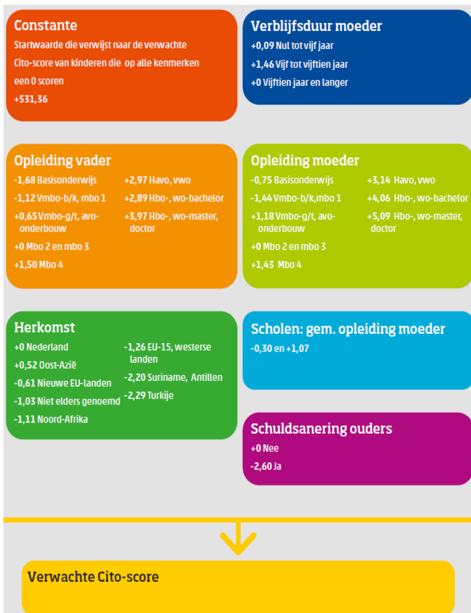
Afbeelding 2. Criteria en rekenmethode voor vaststellen onderwijsscores per gemeente