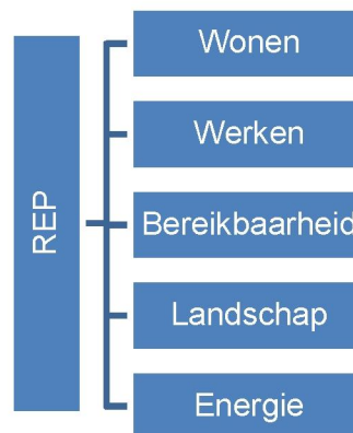
Figuur 1: REP integrerend kader voor regionale afwegingen tot 2040