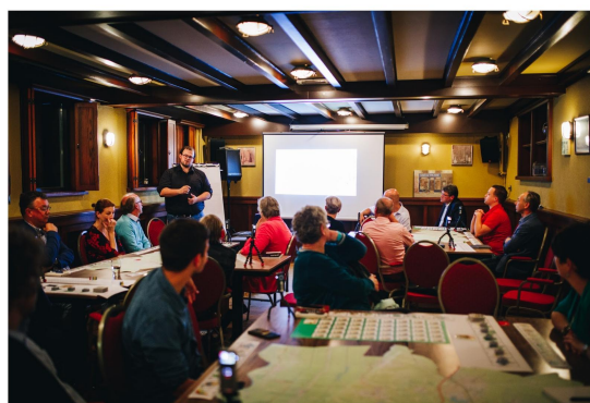
We Energy Game door Hanze Hogeschool