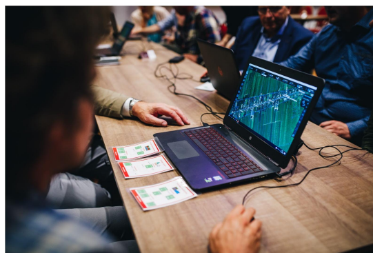
Besturen van de Tygron Engine bodemdalingssgame