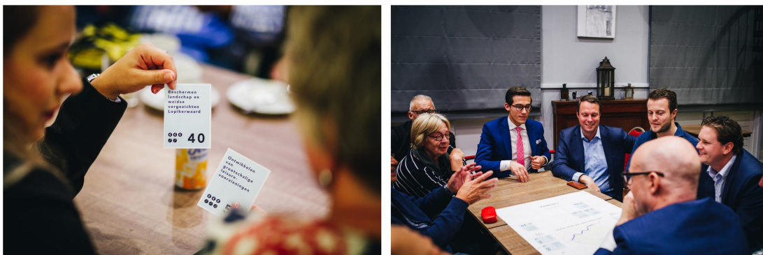
'Aan de slag met het Lopikerwaard Recreatiespel'

Tijdens het Lopikerwaard Recreatiespel heeft u de toekomst op het gebied van recreatie in de Lopikerwaard actief verkend. U werd gevraagd om te bepalen of de interventies op de speelkaarten lokaal, regionaal of vooralsnog niet moeten worden opgepakt in de Lopikerwaard. Daarnaast heeft u aan het einde van het spel zelf interventies kunnen inbrengen.