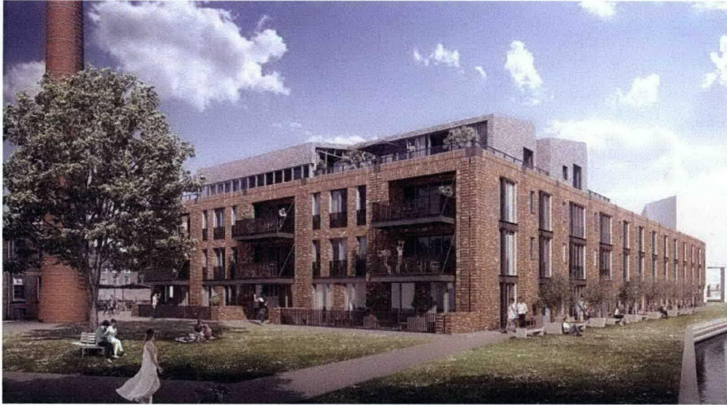
Impressie van fase Midden