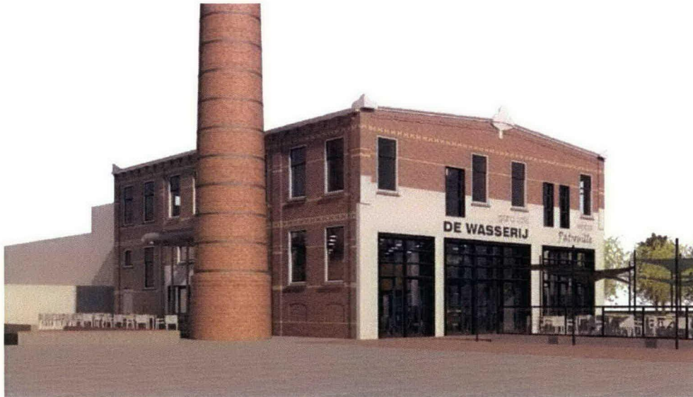
Voorlopige impressie van gebouw De Wasserij

programmatische invulling van gebouw De Wasserij. In gebouw De Wasserij op het Defensie-eiland wordt voor u dan van 19.00 tot 19.30 uur een nadere toelichting gegeven. Daarbij zijn de ontwikkelaar van Defensie-eiland (De Wasserij CV), de beoogd exploitant en vertegenwoordigers van het Cultuur Platform Woerden aanwezig.