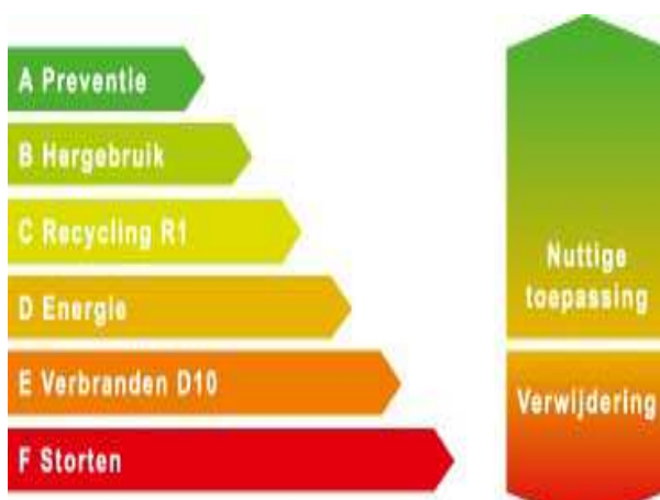
Figuur 2: Ladder van Lansink

Om inwoners blijvend mee te laten werken aan afvalscheiding, zijn drie aspecten belangrijk: Motivatie [willen], Capaciteit [kunnen] en Gelegenheid [juiste omstandigheden].