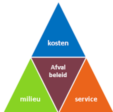
Figuur 1: Afvaldriekhoek

In de wet Milieubeheer is de zorgplicht van gemeenten vastgelegd en via het landelijke afvalbeheer plan (LAP2) de hergebruik -en recyclingdoelstellingen. Om invulling te geven aan de duurzaamheidgedachte van de gemeente, wordt gestreefd naar de optimale balans tussen de dienstverlening (inzameling, transport en verwerking van het huishoudelijke afval), een maximaal milieurendement en de laagst mogelijk verantwoorde kosten. Dit alles onder regie van een afvalbeleid gericht op minimalisering restafval en maximalisering hergebruik.