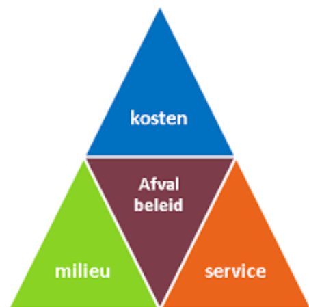
Figuur 1: Afvaldriehoek

In de wet Milieubeheer is de zorgplicht van gemeenten vastgelegd en via het landelijke afvalbeheerplan (LAP2) de hergebruik- en recyclingdoelstellingen. Om invulling te geven aan de duurzaamheidsgedachte van de gemeente wordt gestreefd naar de optimale balans tussen dienstverlening (inzameling, transport en verwerking van het huishoudelijke afval), een maximaal milieurendement en de laagst mogelijk verantwoorde kosten, alles onder regie van een afvalbeleid gericht op minimalisering van restafval en maximalisering van hergebruik.