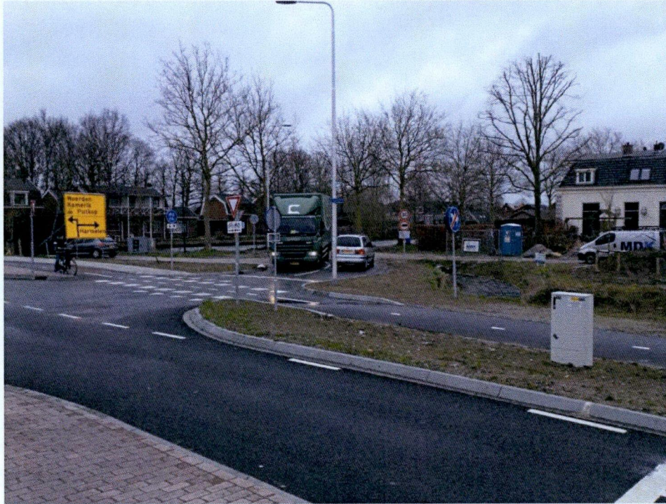
De verbrede aansluiting van de weg Haanwijk op het kruising met de Burgemeester Van Koningsbruggenweg

De verbrede aansluiting van de weg Haanwijk-oost op de kruising is voldoende breed voor verkeer in beide richtingen tegelijk. Autoverkeer richting kruising voegt zich overwegend (zoals bedoeld) tussen de rechtdoor gaande fietsers om op de kruising veilig af te kunnen slaan.