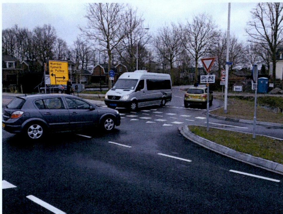
De verbrede aansluiting van de weg Haanwijk op de kruising met de Burgemeester Van Koningsbruggenweg