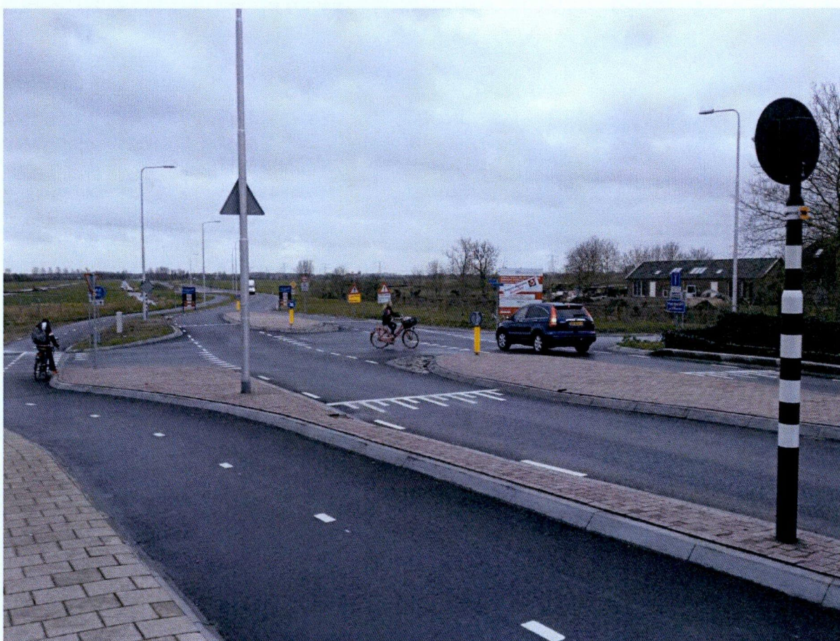
Kruispunt Burgemeester Van Koningsbruggenweg - Haanwijk

Circa 25% autoverkeer vanaf Haanwijk-oost geeft geen richting aan.