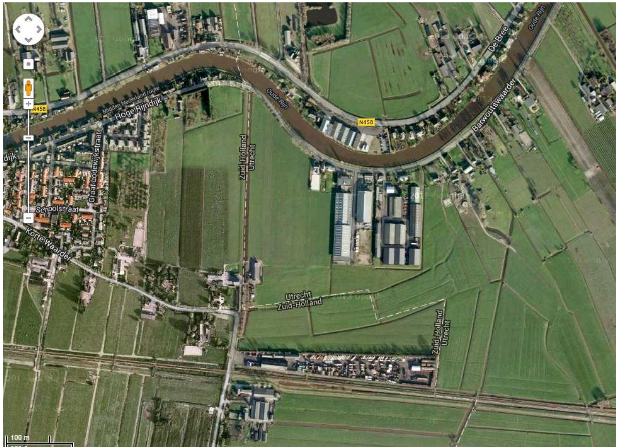
Bestaande situatie omgeving beoogd bedrijventerrein werklint. 6 oktober 2014. RP cv