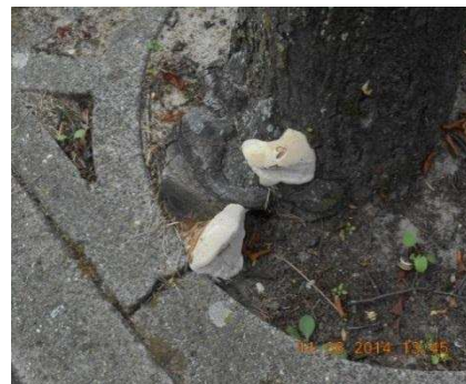
Bomen met gebreken in de gemeente Woerden