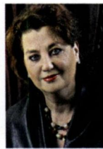
Bussum, R. Kruisinga