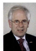
Renswoude, W. Dekker