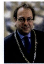
Eemnes, R. van Benthem