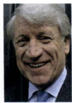
Houten, R.G. Boekhoven