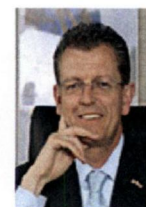
Zeewolde, G. Gorter