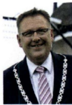
Bunschoten, M. van de Groep