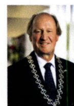
Soest, G. Mik