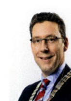
Wijk bij Duurstede, T.R. Poppens