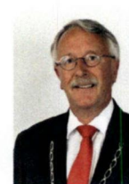
Weesp, B. Horseling