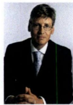
Amersfoort, L. Bolsius