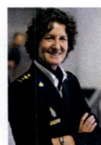
Politie Midden- Nederland, M. Barendse