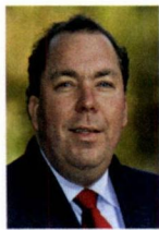
Bunnik, H. Ostendorp