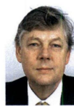
Laren, E. Roest