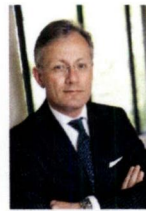
De Bilt, A. Gerritsen