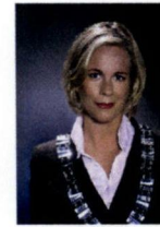
Leusden, A. Vermeulen