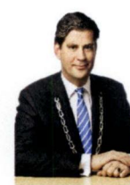
Veenendaal