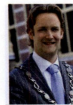
Oudewater, P. Verhoeve