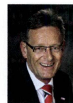
Zeist, J. Janssen