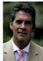
Utrechtse Heuvelrug, G. Naafs