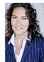
Stichtse Vecht, M. van 't Veld