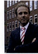
Openbaar Ministerie, J. Bac