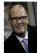
Vianen, W. Groeneweg