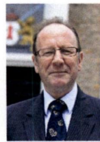
Montfoort, E. Jansen