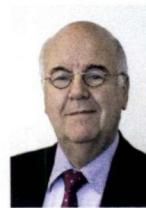
Huizen, A. Hertog