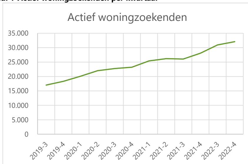
Figuur 7 Actief woningzoekenden per kwartaal