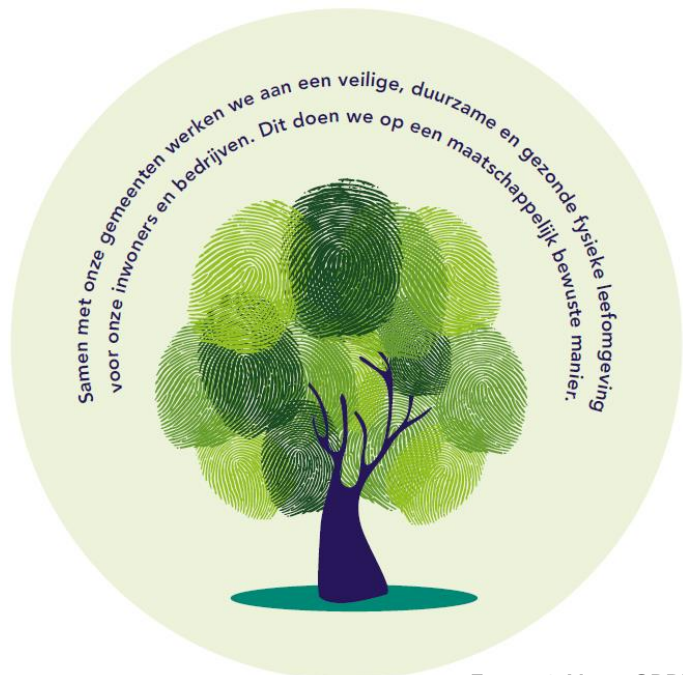
FIGUUR 1: MISSIE ODRU