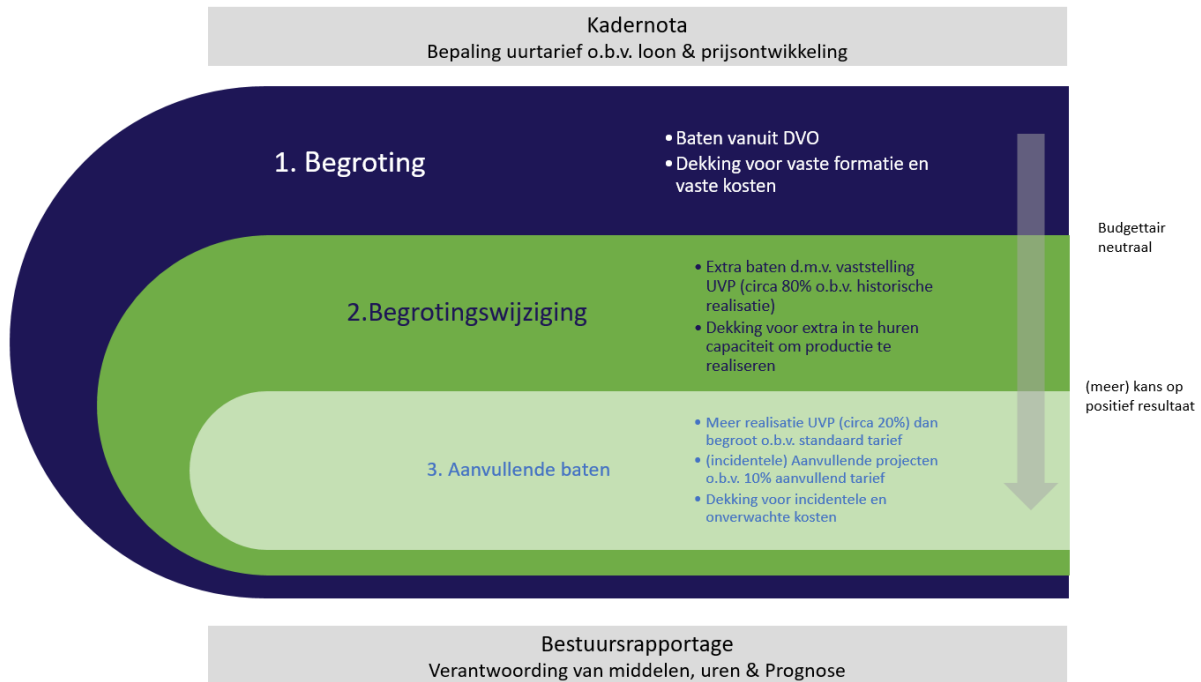
FIGUUR 2: BEGROTINGSMETHODIEK BIJ DE ODRU

Figuur 2 geeft de systematiek van begroten grafisch weer.