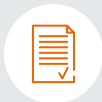
Plan van aanpak