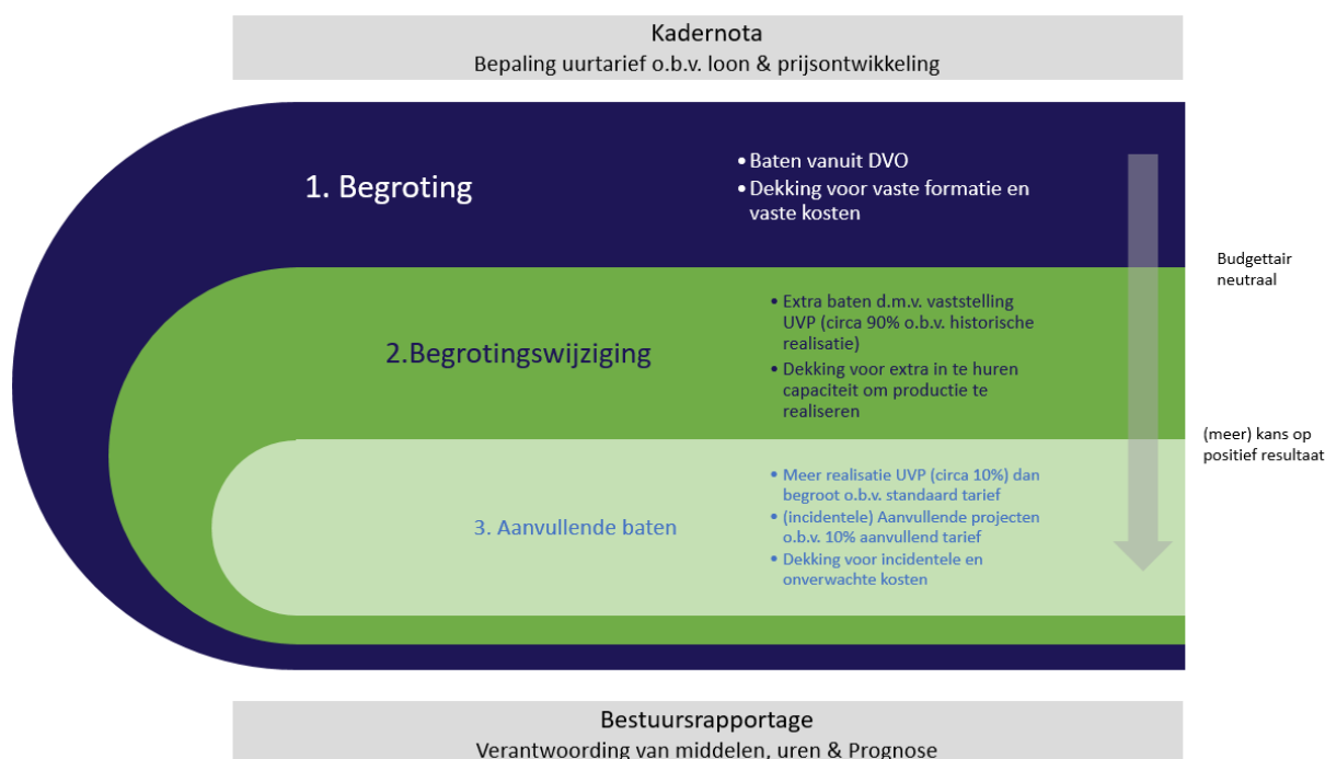
FIGUUR 2: BEGROTINGSMETHODIEK BIJ DE ODRU

Figuur 2 geeft de systematiek van begroten grafisch weer.