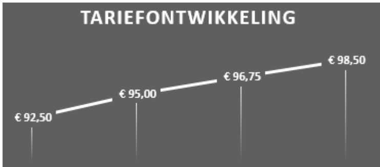
FIGUUR 3: TARIEFONTWIKKELING 2020 - 2023

In de volgende grafiek (figuur 3) is de tariefontwikkeling opgenomen van de afgelopen vier jaar. Hierin is af te lezen dat afgelopen vier jaar het tarief steeds matiger is gegroeid. In het eerste jaar was er een stijging van vanwege de loon- en prijsontwikkelingen € 2,50 per uur en dit jaar wordt er, net als vorig jaar, een stijging voorgesteld van € 1,75 per uur.