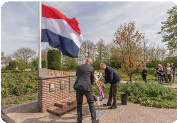
4 MEI DODENHERDENKING