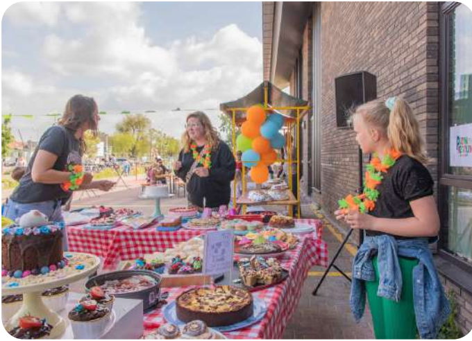
PLEINFESTIJN BIJ DE WIJDE BLIK