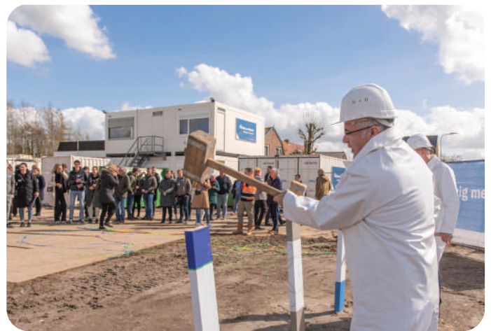
START BOUW WEIDSE WEELEDE