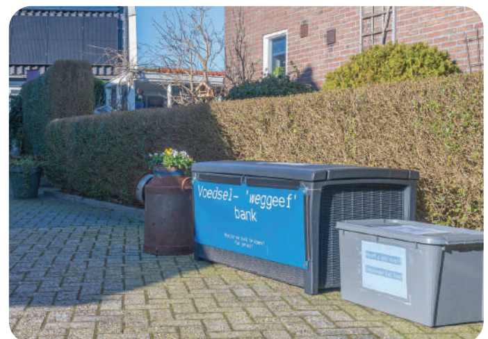
VOEDSELBANK: MEENT 2