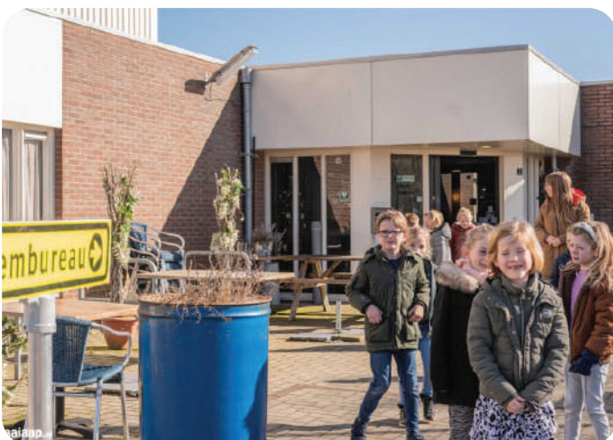
EXCURSIE NAAR HET STEM BUREAU