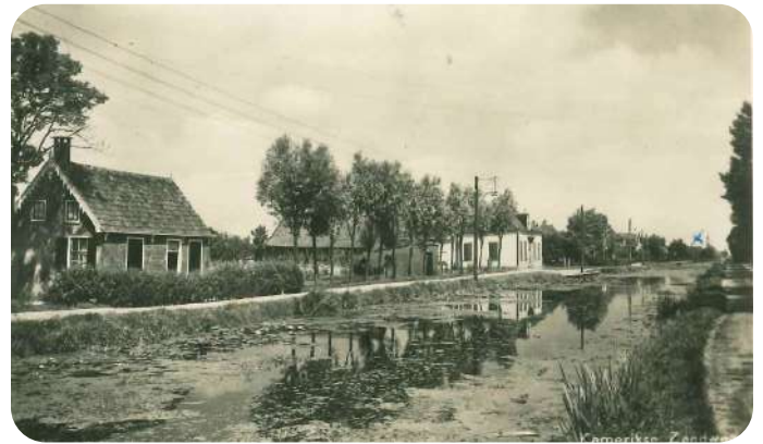
Het witte huis stond op de plek waar nu De Schulenburg staat.