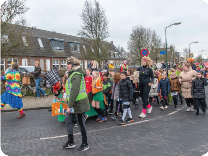
CARNAVALSOPTOCHT DE WIJDE BLIK