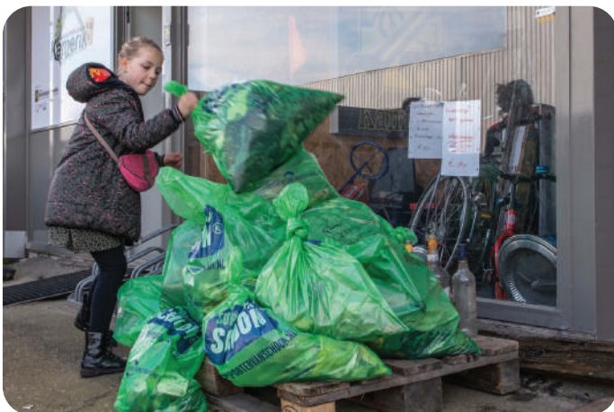
Jong en oud deed mee.

Op zaterdag 18 maart was het weer zover: de Landelijke Opschoondag vond plaats. Op die dag maken vrijwilligers in het hele land hun eigen wijken en buurten schoon. Ook Kamerik deed weer mee. En met succes! Vele zakken vuil werden van de straat gehaald en uit de sloten gevist. Snoeppapiertjes, peuken, bierdoppen, piepschuim, allerlei stukjes plastic en nog veel meer. En ook vijf geleegde whiskyflessen werden in het wild gevonden. In totaal deden meer dan dertig mensen mee, jong (vanaf twee jaar) en oud. Behalve dat het nuttig is