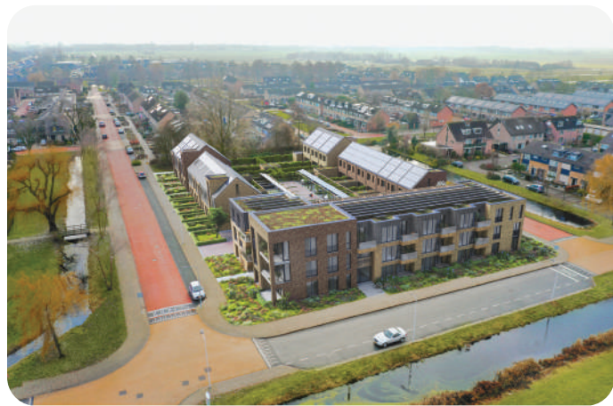
Ontwerp van BEMOG.

Op 16 maart ontvingen we een persbericht van de gemeente dat BEMOG is geselecteerd voor de nieuwbouw op de voormalige plek van basisschool De Wijde Blik aan de Overstek in Kamerik. Van de ingeleverde plannen beoordeelde de jury het plan van BEMOG als beste. Op 16 maart 2023 tekenden beide partijen de ontwikkelingsovereenkomst. Als alles meezit kan de bouw eind 2024 van start. Het plan "De Opkamer" bestaat uit 37 woningen en appartementen