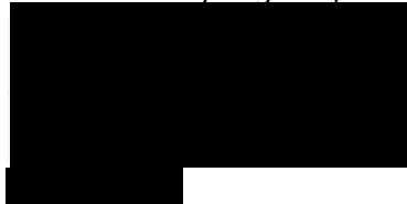
Voorzitter Raad voor het Openbaar Bestuur