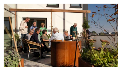
Marktmeesters, Utrecht (Kees Hummel)