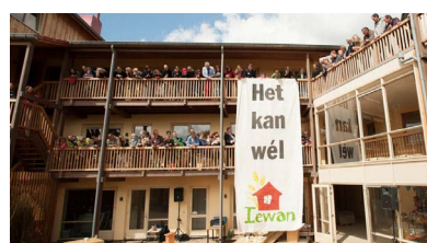
lewan, Nijmegen (Wen Versteeg)