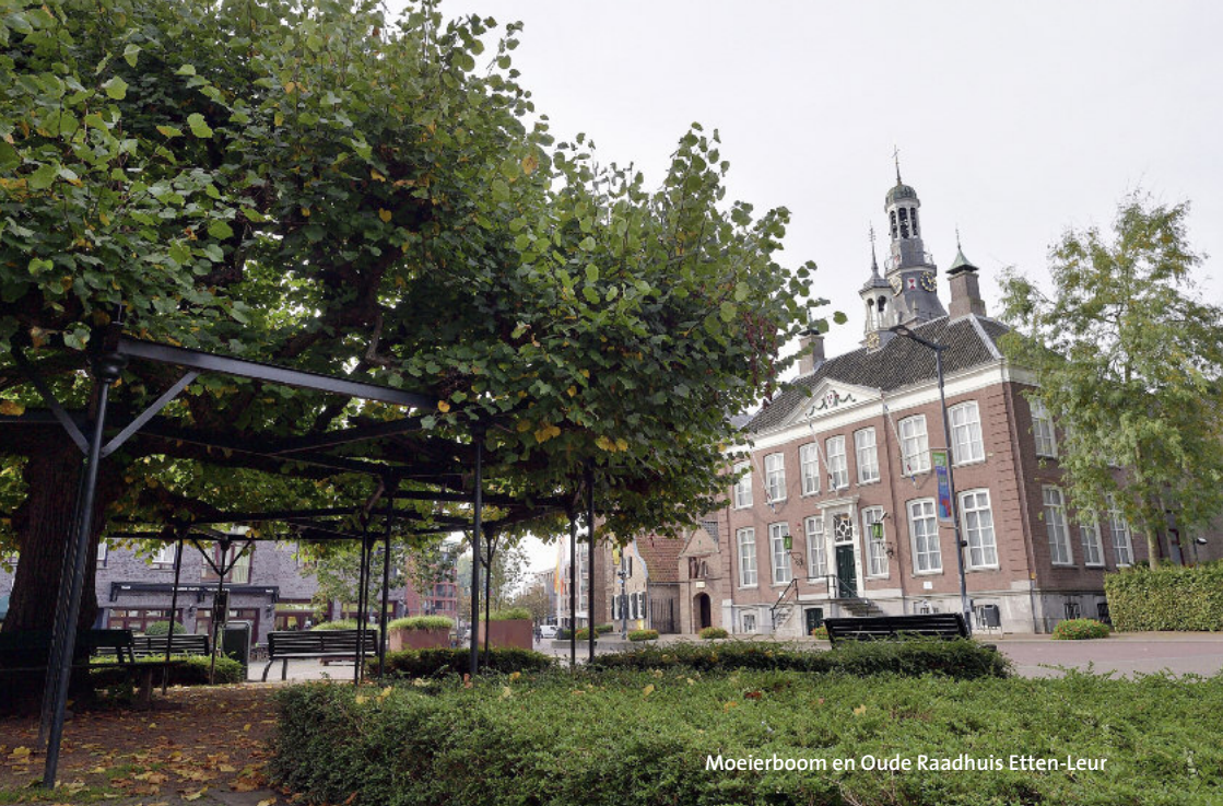
Moeierboom en Oude Raadhuis Etten-Leur

De samenleving organiseert zich steeds meer horizontaal en in flexibele netwerken. Als gemeente wil je aansluiten bij de samenleving en denken vanuit mogelijkheden en behoeften van inwoners, ondernemers, onderwijsinstellingen en maatschappelijke organisaties. Daarvoor is het nodig dat gemeenteraad, college en ambtelijke organisatie werken op basis van overheidsparticipatie. De gemeenteraad bepaalt dan samen met alle partners wat de komende vier jaar moet worden bereikt. Het college en de ambtelijke organisatie werken dit vervolgens samen met die partners uit. Niet tegenover elkaar, maar naast elkaar bundelen we de krachten. Samen maken we Etten-Leur. [Wim Voeten]