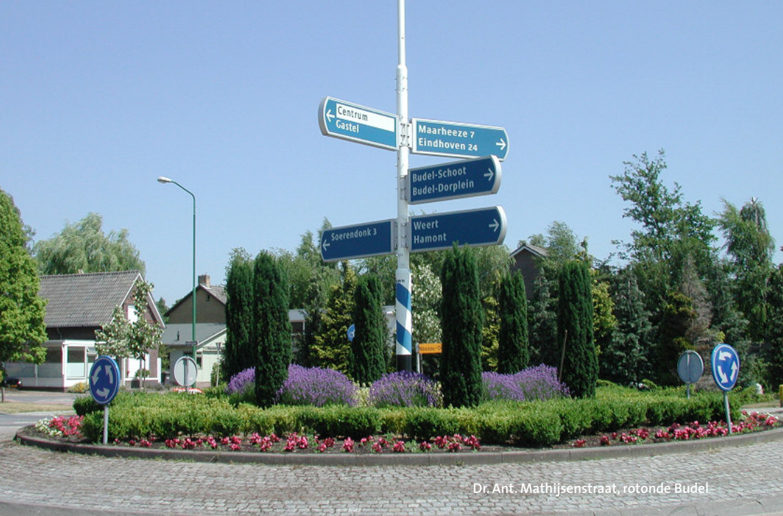
Dr. Ant. Mathijssenstraat, rotonde Budel

Inwoners doen het graag zelf, geef ze de ruimte. Er zit onwaarschijnlijk veel kennis bij inwoners, door scholing of ervaring gekregen. Betrek inwoners daarom aan de voorzijde van alle plannenmakerij in een gemeente en je zult zien dat dit resulteert in breed gedragen besluiten en een beter eindresultaat!