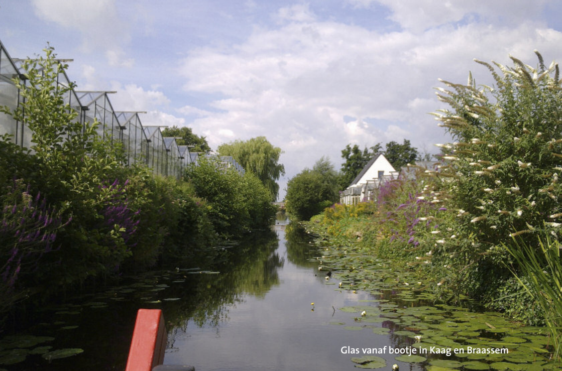
Glas vanaf bootje in Kaag en Braassem

Met het raadsakkoord en meepraten aan de voorkant hebben we de kennis en kunde van onze inwoners binnengehaald. Wat achterblijft is de blijvende betrokkenheid van inwoners bij het politieke proces in het algemeen. Mensen praten mee over projecten in hun eigen buurt, maar de raadsvergaderingen worden niet beter bezocht. Het nieuwe systeem sluit dus niet aan op het oude systeem van gemeenteraad met raadsvergaderingen. Dat wil mijn partij veranderen, dus nu bezinnen we ons op een andere invulling van de gemeenteraad. Denk aan een informatiemarkt in plaats van een raadsvergadering. Dat is laagdrempeliger voor bezoekers en ook makkelijker inspreken dan achter een microfoon in een raadsvergadering waar alle ogen op je gericht zijn. [Floris Schoonderwoerd]