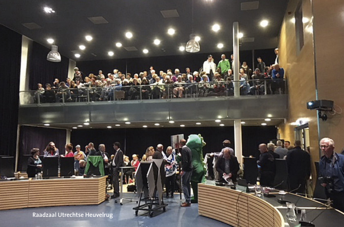
Raadzaal Utrechtse Heuvelrug

Inwoners zitten niet te wachten op gehacketak en politiek gedoe. Zoek als politieke partijen naar wat je bindt, niet naar wat je verdeelt. [Hugo Prakke]