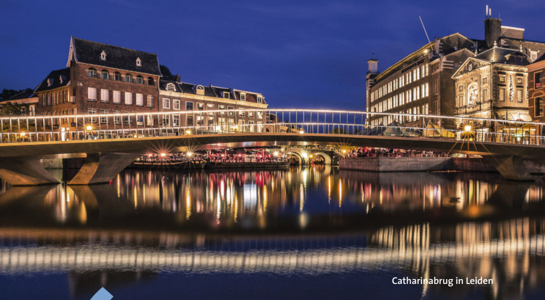
Catharinabrug in Leiden

Het mooiste compliment dat ik na de collegeonderhandelingen heb gekregen, kwam van een van de onderhandelaars: 'Je hebt alles opgeschreven zoals ik het eigenlijk had willen zeggen.' Doordat ik van begin tot eind bij alle inhoudelijke besprekingen heb gezeten, kon ik snel de bedoeling van alle afspraken in de juiste woorden vatten. Dat lukt alleen als er vertrouwen is tussen onderhandelaars en ambtelijke ondersteuning, en als je je inhoudelijk goed hebt voorbereid.