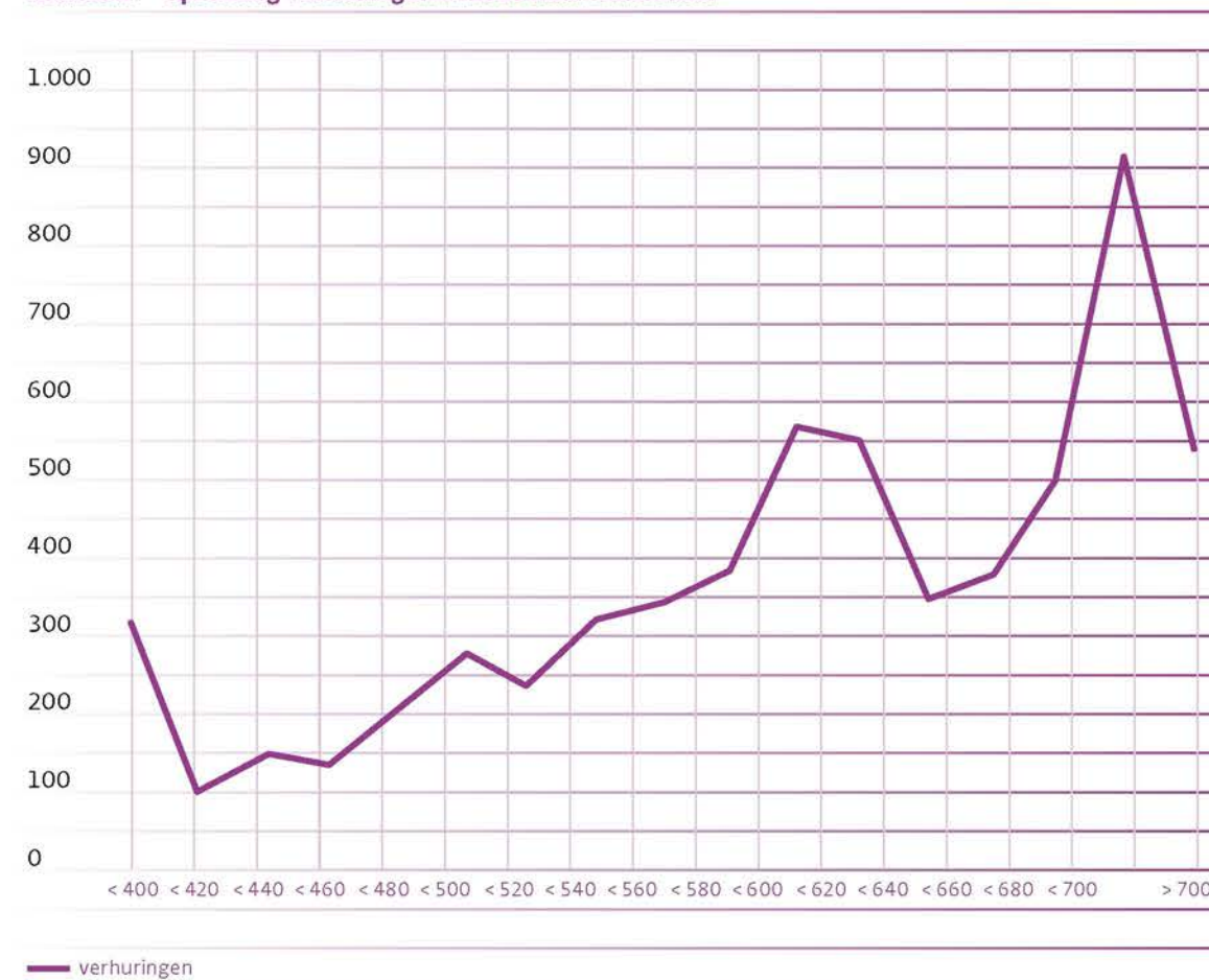
Grafiek 1 Spreiding verhuringen in 2015 naar rekenhuur