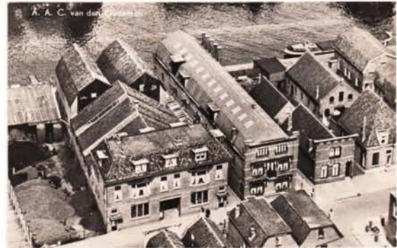
Oude luchtfoto van Mak's Wijnhandel

Onze werkgroep is hierbij ingeschakeld om daarmee zoveel mogelijk gebruik te maken van lokale kennis.