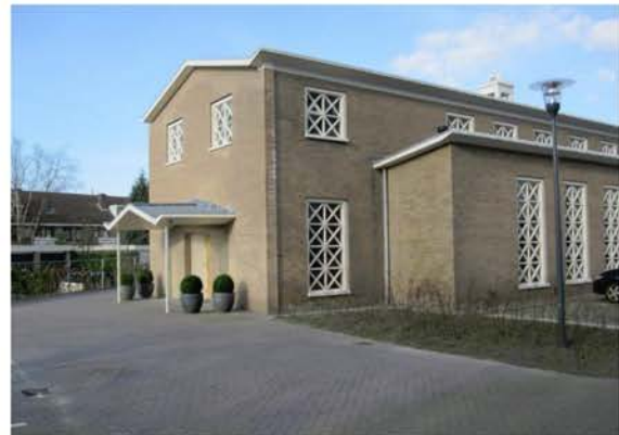
Franciscuskapel met nieuwe west-gevel