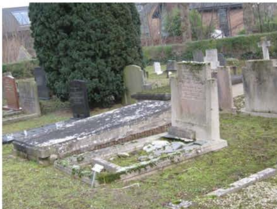
Kerkhof Leidsestraatweg is dringend toe aan een opknapbeurt