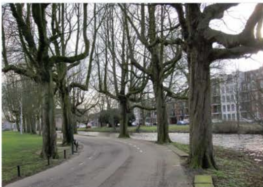
Kastanjabomen bij het Exercitieveld

Over de toekomst van het Exercitieterrein wordt al een aantal jaren gepraat. Volgens de eerste plannen van de gemeente zou de huidige beplanting in zijn geheel moeten wijken omdat de kastanjabomen ziek zijn. Er zijn toen drie keuzevoorstellen gemaakt voor een nieuwe inrichting van het veld.