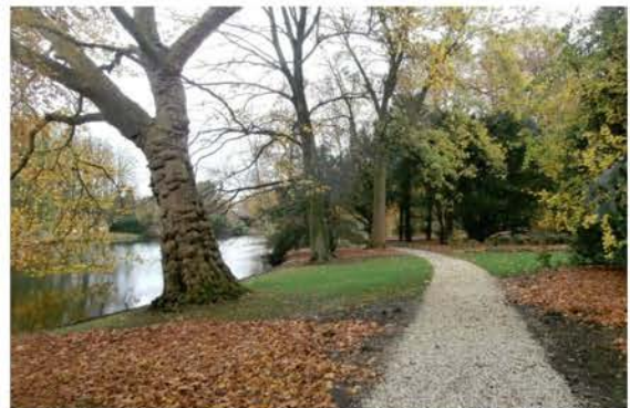
Historische parkaanleg bij de villa

Voor de wandeling was veel belangstelling. De uitreiking van de oorkonde vond plaats in het Brediusshonk.