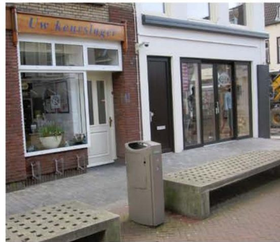
Rechts : Kruisstraat7

In de Woerdense binnenstad is in 2015 de bijzondere gevel van Kruisstraat 7 (voorheen kapper Kemp) bij een verbouwing compleet gewijzigd. Dit is een verlies voor de binnenstad. De werkgroep heeft hierover vragen gesteld aan de gemeente.