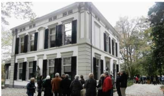
Rondleiding door de tuin

Met de toekenning van de oorkonde 2015 wil Stichting Hugo Kotestein ook de schijnwerper richten op de pas opgerichte Stichting Landgoed Bredius, ontstaan door een bundeling van organisaties die een grote betrokkenheid hebben met het park. Het Landgoed Bredius is van grote natuurlijke, cultuurhistorische en recreatieve waarde voor de Woerdense gemeenschap. De Stichting Hugo Kotestein heeft veel waardering voor alle plannen die de nieuwe stichting met het landgoed heeft.