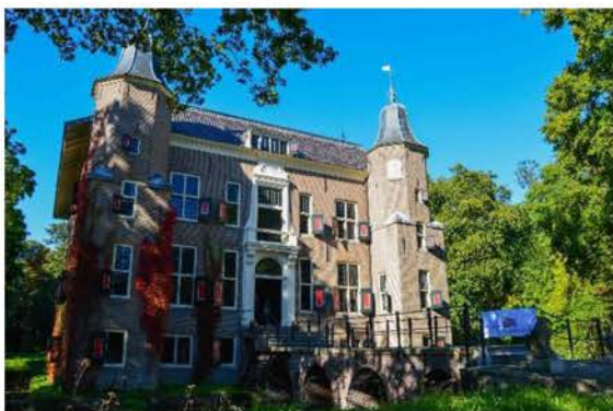
Huis te Linschoten

Op een prachtige vrijdagmiddag, 2 oktober 2015, werden ruim 70 mensen ontvangen in het Huis te Linschoten voor het jubileumprogramma. Wat een schitterende locatie en wat fijn dat we deze mochten gebruiken!