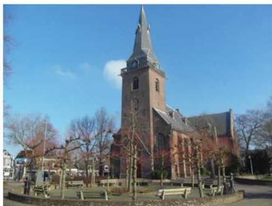
Praatkuil op het kerkplein

Tijdens opgraving/ontgraving is gezocht naar archeologische fondsen of sporen van de vermoedelijke Romeinse Limes. Er zijn geen overblijfselen van de Limes gevonden. Het Kerkplein zal ook opnieuw worden ingericht. Door omwonenden en inwoners van Harmelen is kenbaar gemaakt het jammer te vinden dat de huidige "Praatkuil" zal verdwijnen.