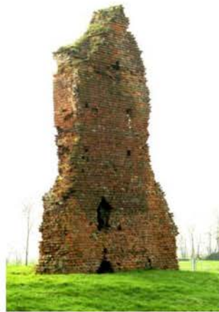
Ruïne Huis te Vliet

De werkgroep Oudewater heeft van dit Rijksmonument een serie foto's gemaakt om de gemeente erop te wijzen dat het gebouw grondig gerestaureerd moet worden, zodat het pand voor de toekomst veiliggesteld wordt.