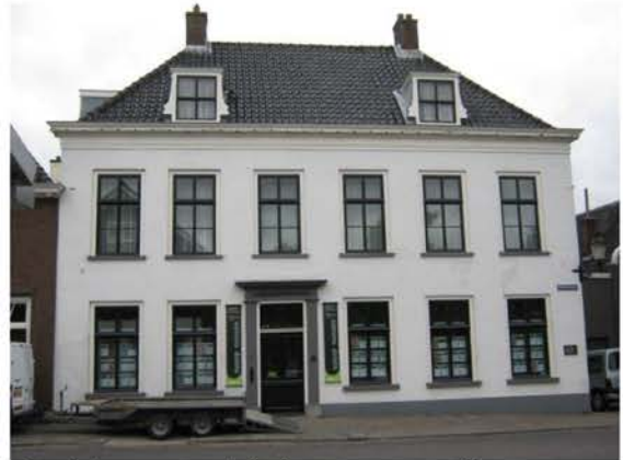
Oudste gemeentehuis van voormalige gemeente Harmelen

en 20e eeuw er aan toeging op een dorpsgemeentehuis.