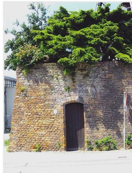
Stadsmuur onder de molen De Valk

De gemeente zelf, eigenaar van het poortje bij de Zevenhuisstaat, zou een goed voorbeeld kunnen geven door dit gedeelte te herstellen. De stadsmuur is tenslotte een historisch visitekaartje voor Montfoort.