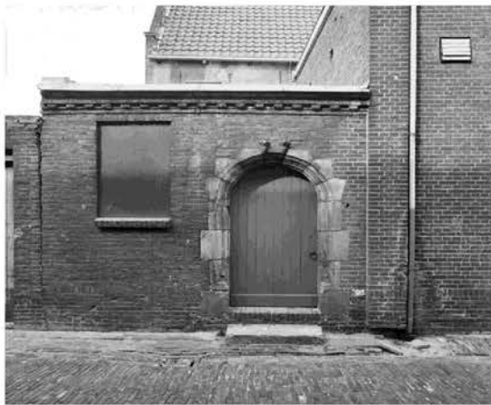
Gildepoortje in Kazernestraat vóór 1977

In 2014 heeft de werkgroep een rondgang gemaakt door de binnenstad, daarbij zijn veel plekken bekeken waar het poortje zou kunnen komen. In de binnenstad zijn veel stegen, het Gildepoortje zou de toegangspoort tot één van deze stegen kunnen zijn. Maar steeds was er iets waarom dat niet kon. Er bleef nog één plek over: tussen Museum en Mariaschool