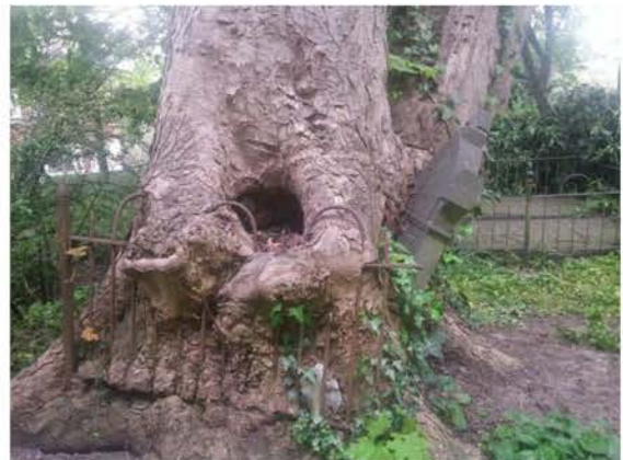
Een opknapbeurt nodig

Ondanks een herhaald verzoek over de stand van zaken hierover bij de gemeente blijft het stil.