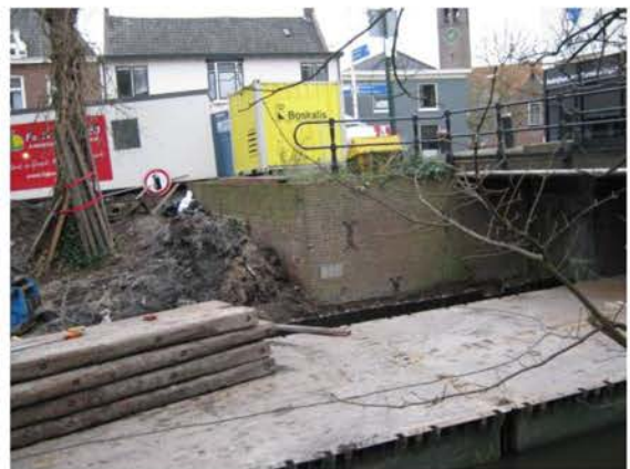
Dorpsstraat op de schop bij de brug. De ingemetselde steen met het jaartal 1624 is ook zichtbaar. (Elders in het verslag staat meer informatie over deze steen.)

De werkgroep heeft de plannen van herinrichting bekeken en geen aanleiding gevonden om uit historisch oogpunt bezwaar in te dienen.