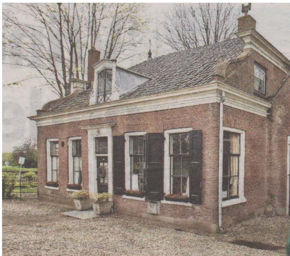
Rietveld 25 – 25a

Na de restauratie wordt het pand verkocht.