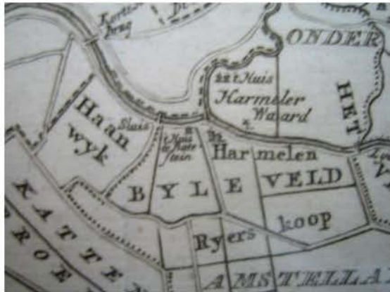
Haanwijk en Hollandse kade in 1696

In mei 2015 is er een informatieavond geweest, waarin gemeente Woerden en Maatschap Haanwijk voorlichting gaven over de bouwplannen in polder Haanwijk. Dit heeft geleid tot veel protesten.