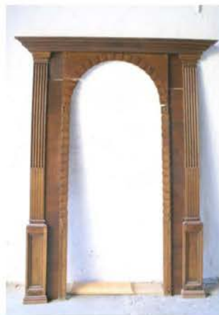
Poortje van de Synagoge

In het begin van de twintigste eeuw woonden er verschillende Joodse families in Oudewater. De meeste families die hier woonden, waren in 1940 om diverse redenen al uit Oudewater vertrokken. In de Korte Havenstraat 22 stond vroeger een kleine synagoge. Deze synagoge is verdwenen. Het enige tastbare van deze synagoge dat nog behouden is, zijn een kozijn en een deur die zich in een nieuwbouw woning in Oudewater bevinden.