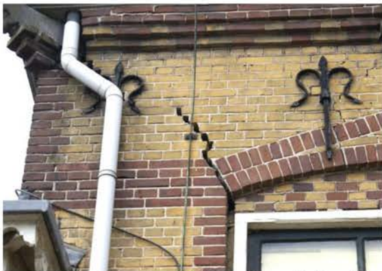
Scheur in de oude Openbare School

Hetzelfde geldt voor het oude postkantoor in de Leeuweringerstraat. Dit Rijksmonument wordt al vele jaren schromelijk verwaarloosd. Het dak lekt, de goten en sommige ramen zijn kapot. Ook hier kan men spreken van het moedwillig laten verpauperen van een Rijksmonument. Daarbij zet de eigenaar de gemeente ten onrechte onder druk om een onacceptabele aanbouw aan de achterzijde goed te keuren. Dit zou in strijd zijn met het beschermd stadsgezicht waarin duidelijke regels gesteld zijn omtrent het aanzicht op achterzijde en tuinen van dit pand aan de haven. Na vele verzoeken van o.a. de werkgroep Oudewater is de monumentale kastanjeboom in de achtertuin van het pand in 2015 gelukkig weer op de boomenlijst geplaatst.