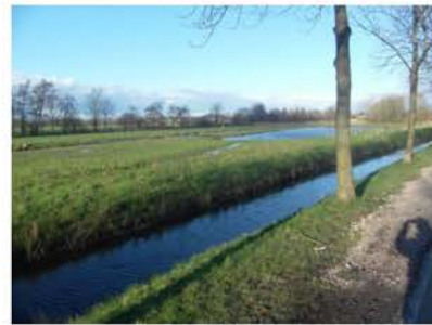
Natuurgebied De Kievit aan de Hollandse kade en daarachter polder Haanwijk

Onze bijdrage is voornamelijk het document "Haanwijk: Cultuurhistorische waarde", dat onder meer naar alle fracties van gemeente Woerden is verzonden.