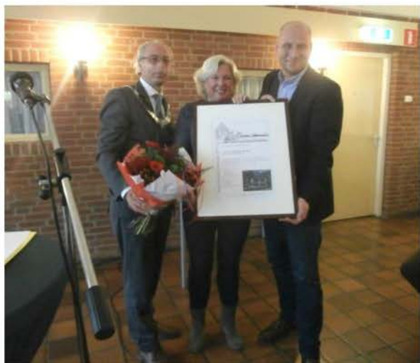
De uitreiking van de oorkonde