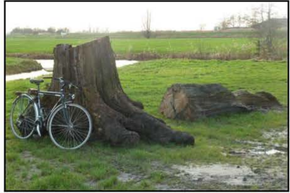
De Kamerikse veeneik op zijn nieuwe plek aan de Houtkade bij de Grechtkade in Oud-Kamerik

Na overleg met het waterschap en natuurmonumenten zijn enkele kleinere veeneikstronken ter beschikking gesteld van het bezoekerscentrum van natuur-monumenten in Nieuwkoop.