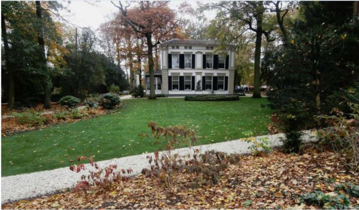
De historische tuin bij Villa Rijnoord

Met de toekenning van de oorkonde 2015 wil Stichting Hugo Kotestein ook de schijnwerper richten op de pas opgerichte Stichting Landgoed Bredius, ontstaan door een bundeling van organisaties die een grote betrokkenheid hebben met het park. Het Landgoed Bredius is van grote natuurlijke, cultuurhistorische en recreatieve waarde voor de Woerdense gemeenschap. De Stichting Hugo Kotestein heeft veel waardering voor alle plannen die de nieuwe stichting met het landgoed heeft.