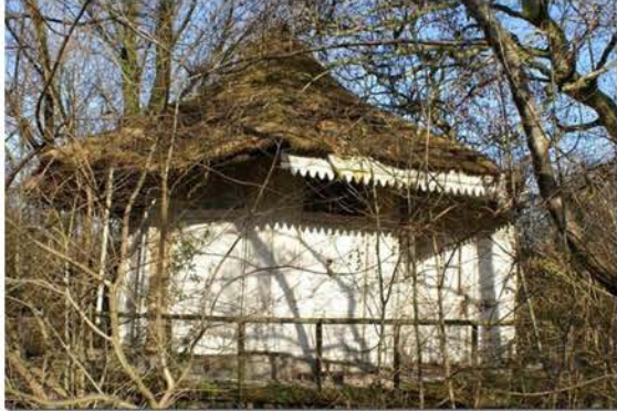
Theekoepel Van Aelst

De werkgroep Oudewater heeft in 2015 diverse brieven over dit onderwerp aan de gemeente Oudewater gestuurd.