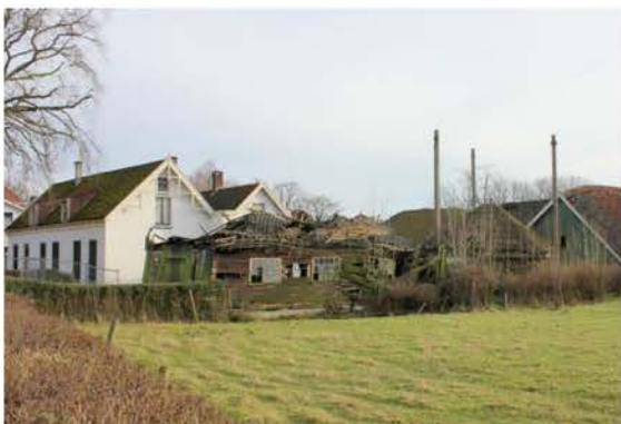
Boerderij Liefhoven met vervallen timmerwinkel

Na het overlijden medio 2013 van de laatste bewoner, de heer Cromwijk, kwam dit markante en beeldbepalende boerderij-complex leeg te staan. Sinds einde 2013 staat het te koop.