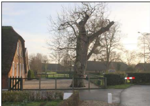
De verankerde okkernootboom

In 2014 werden door ingrijpen van de werkgroep twee bijzonder oude okkernootbomen aan de Nieuwe Zandweg behouden. Door expertise op het gebied van monumentaal groen in de werkgroep en met financiële hulp van de Bomenstichting en de gemeente lukte het de 350 jaar oude bomen voor kap te behoeden.