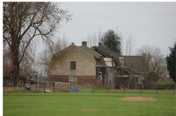
De bazenwoning naast de steenovenschuur

Een groep van direct omwonenden heeft met de werkgroep en de Werkgroep Behoud Lopikerwaard in 2011 de handen ineen geslagen om een einde te maken aan een jarenlange impasse rond het IJsseloordterrein. Eerdere plannen van Jan Snel B.V. voor het terrein kregen totaal geen steun en verzandden in eindeloze bezwaarprocedures.