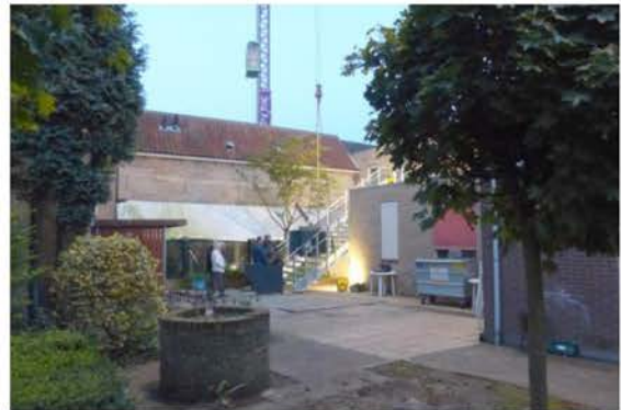
De trap in de Kloostertuin

De Kloostertuin achter de Commanderie en Kloostergang heeft in het bestemmingsplan Binnenstad de bestemming Tuin met Cultuurhistorische Waarde (Tuin CW). In de praktijk is daar echter niet veel van te zien. In 2013 betrok de Hersteld Hervormde Gemeente (HHG) de bovenverdieping van het Rabobank gebouw. Als toegang tot de verdieping werd in de tuin zonder vergunning een grote nieuwe trap geplaatst. Hier tegen heeft de werkgroep bezwaar gemaakt. De werkgroep is van mening dat de trap het aanzien van de tuin en de monumenten Commanderie en Kloostergang ernstig aantast.