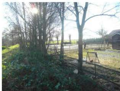
Polder Haanwijk grenst aan de Hollandse kade