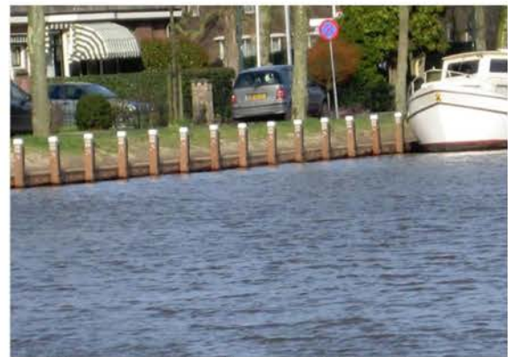
Nieuwe beschoeiing van de Singeloever

In 2015 is gestart met het vervangen van de beschoeiingen in het zuidelijk deel, dit werk loopt door in 2016. Voor 2017 staat vervanging van de beschoeiingen in het noordelijk deel op de rol.