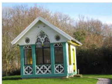
Tuinhuis 't Spijck na de opknopbeurt

Het tuinhuis bij Huize Harmelen dat in 2001 het predicaat "Rijksmonument" kreeg en in 2006 de oorkonde van onze stichting in ontvangst mocht nemen, baarde ons zorgen vanwege de onderhoudstoestand waarin het verkeerde.