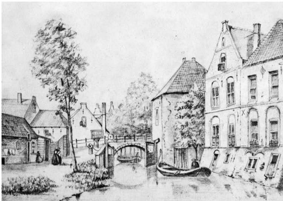
Tekening van de Romeijnbrug

In 2015 is het samenwerkingsverband met de gemeente Woerden van start gegaan. In eerste instantie waren er wat overgangsproblemen met de organisatie van de diverse afdelingen. Op 1 augustus 2015 moest de werkgroep Oudewater melding maken van het feit, dat wij vanaf 1 januari acht brieven naar de gemeente gestuurd hadden, waar nog geen response op gekomen was. De reactie kwam toen alsnog. Toch is er het gevoel dat de afstand tussen de gemeente en de bevolking groter geworden is. Het stadskantoor is leeg, de contacten zijn op afstand, waardoor de betrokkenheid vermindert. Het schijnt dat de contacten over meer schijven moeten lopen wat de procedures ingewikkelder maakt. Wij hopen dat het college, de ambtenaren, de raad en de politiek er alles aan zullen doen om de contacten met de bevolking zo goed mogelijk te onderhouden en het vertrouwen te verbeteren.