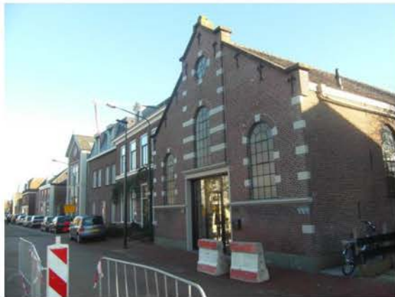
Voormalige Gereformeerde kerk en pastorie

Gemeente Woerden zal begin 2016 de procedure voor aanwijzing van de voormalige gereformeerde kerk en naastliggende pastorie tot gemeentelijk monument opstarten.