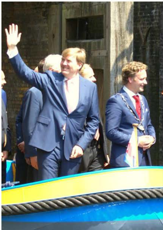
Koning Willem Alexander bezoekt Oudewater

De werkgroep Oudewater die zich ten doel stelt monumenten en de cultuurhistorische waarden in de binnenstad en de buitengebieden voor het nageslacht te behouden, probeert dat te realiseren door het geven van adviezen, het plegen van overleg, het uitgeven van publicaties en indien nodig door bezwaar aan te tekenen. Op deze wijze probeert de werkgroep bij de politiek, de gemeente en de bevolking een draagvlak te vinden om het bewustwordingsproces te vergroten.