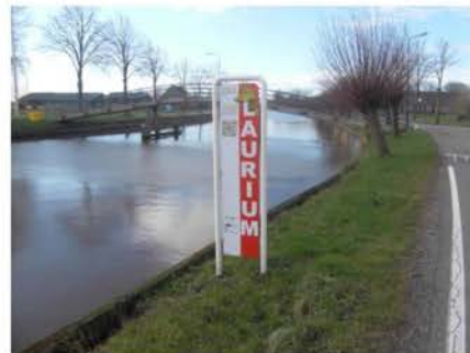
Limesbord aan Harmelerwaard, voorzijde

Aan de Haanwijk en de Harmelerwaard zijn door de gemeente limesborden geplaatst.