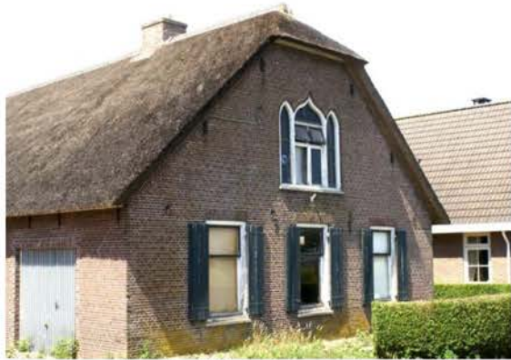
Boerderij Papekopperstraat 64

worden. De boerderij kan dan op de cultuurhistorische waardekaart opgenomen worden.