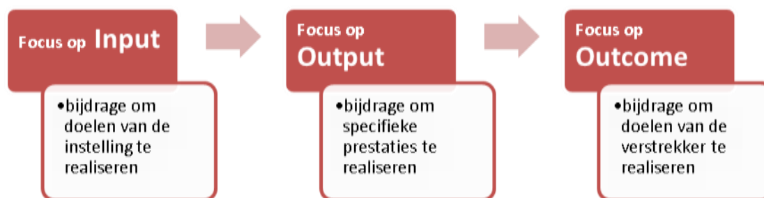
FIGUUR 2.1: ONTWIKKELING DRIE VERSCHILLENDE TYPEN SUBSIDIEVERSTREKKING

De focus op outcome, en daarmee op de doelen die de subsidieverstrekker wil realiseren, dient op verschillende momenten in het subsidietraject aan de orde te komen, namelijk in de subsidieverordening, bij de subsidieaanvraag, bij de verleningsbeschikking en bij de vaststelling van de subsidie.