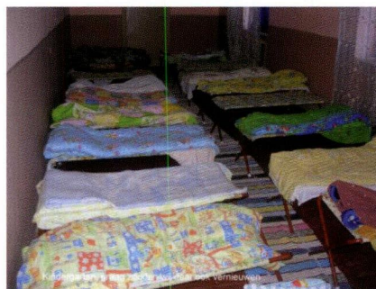
Slaapzaal in kindergarten, dat willen wij aanpakken.

Sieu; Is dit jaar niet meer bezocht. De brandweerauto werd altijd goed onderhouden en daarom hebben wij dit jaar over geslagen.