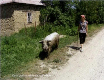
daar gaat de winter voorraad

Omdat de verschillende projecten in Beregszasz gekoppeld zijn ondersteunen deze elkaar.