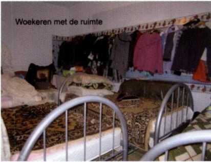
Woekeren met de ruimte