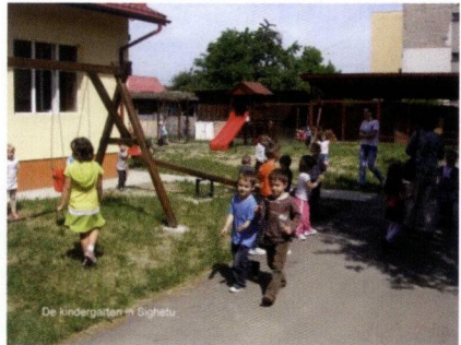
Kindergarten in Sighetu

Het Kinderopvanghuis, een tehuis voor verstandelijk gehandicapten kinderen en een tehuis voor volwassen verstandelijk