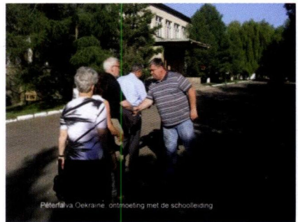
Bezoek aan de school in Pèterfalva

Rafajnaùfalu ; Voor een verwarmingssysteem in de medische post is € 4.000 beschikbaar gesteld en dat is voor de winter geïnstalleerd. Grappige bijkomstigheid; in het zelfde gebouwtje zetelt ook de burgemeester. Die zit er nu letterlijk, ook warmpjes bij. In Tivadarfalvi en Pèterfalva hebben de scholen veel materiaal ontvangen.