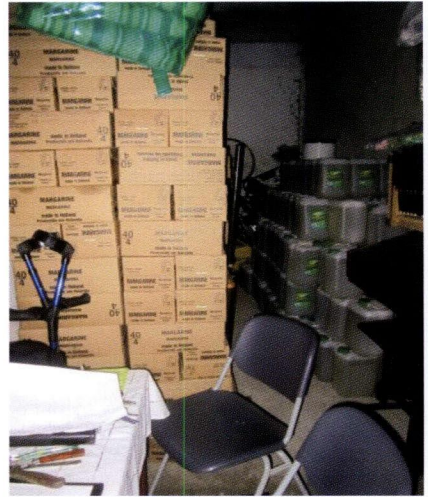
Een magazijn in Moldavië

gezien de problemen in Kiev kan dit nog wel langer duren.