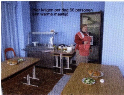
60 personen krijgen hier een warme maaltijd in Soldanesti

gemeente in hun initiatieven te steunen en ook deze plaats op te nemen in onze transporten.