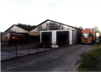
Een transport wordt geladen