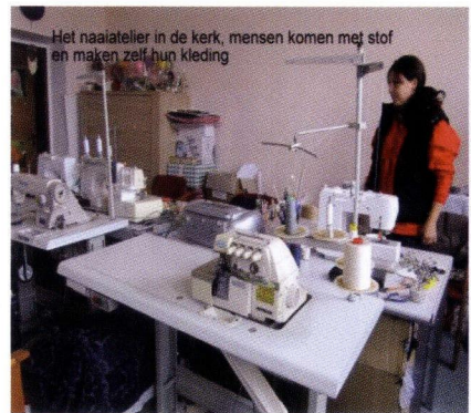
Een naaiatelier in de kerk

Wij zijn in dit land nog duidelijk aan het bouwen aan verschillende projecten. Voor beide partijen een kerken duidelijk een sociale functie; onderdak voor kinderen en ouderen, voedselverstrekking en educatie zijn speerpunten.