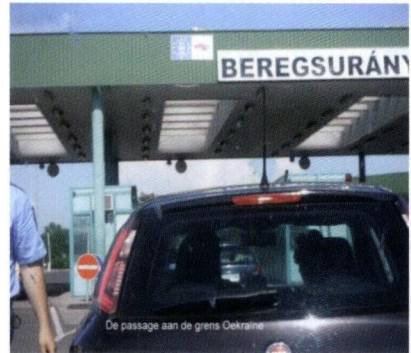
de grens Hongarije-Oekraïne

Beregszasz ; dat is de hoofdplaats van deze grensstreek. Hier is het Diaconaal Centrum van de Hongaars Gereformeerde Kerken in de Oekraïne gevestigd. Meer