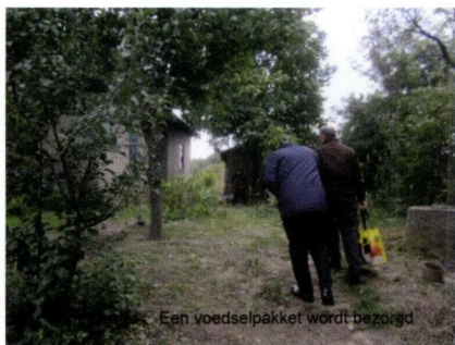
Een voedselpakket wordt bezorgd

Missions Reliëf, zij verzorgen de documenten pro deo en hebben veel kennis in huis t.a.v. transportdocumenten.