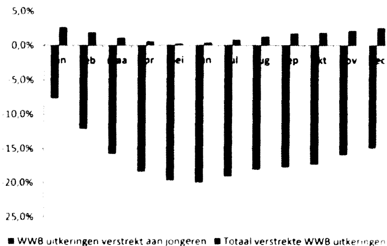
Figuur 3.1 Mutatie aantal bijstandsuitkeringen in 2012 t.o.v. van dezelfde maand in 2011

Cijfers van het CBS geven een indicatie dat de aangescherpte uitkeringsvoorwaarden voor jongeren er toe leiden dat minder jongeren een beroep doen op de WWB. De ontwikkeling van het aantal bijstandsuitkeringen verstrekt aan jongeren laat sinds de introductie van deze maatregelen een forse daling zien (zie figuur 3.1). Deze ontwikkeling is tegengesteld aan de landelijke trend dat het totaal aantal verstrekte WWB uitkeringen juist toeneemt.