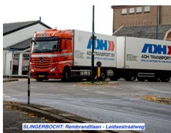
SLINGERBOCHT: Rembrandtlaan - Leidsestraatweg