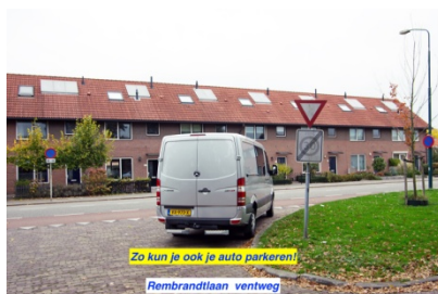
Zo kun je ook je auto parkeren! Rembrandtlaan ventweg