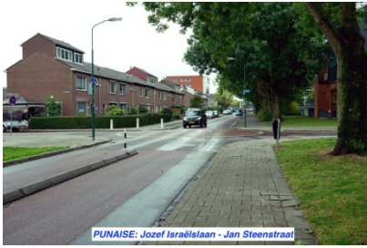
PUNAISE: Jozef Israëlslaan - Jan Steenstraat