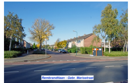
Rembrandtlaan - Gebr. Marisstraat