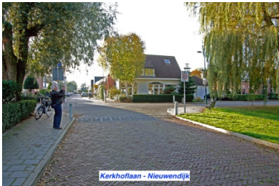
Kerkhoflaan - Nieuwendijk