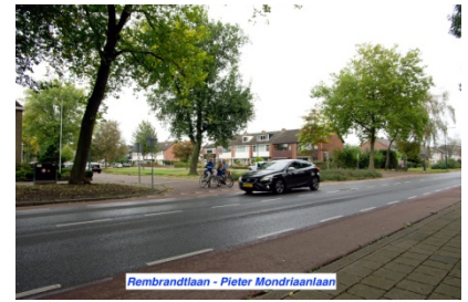
Rembrandtlaan - Pieter Mondriaanlaan