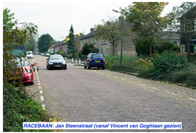
RACEBAAN: Jan Steenstraat (vanaf Vincent van Goghlaan gezien)