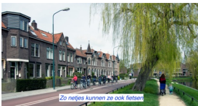
Zo netjes kunnen ze ook fietsen