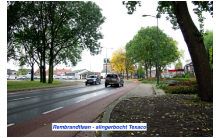
Rembrandtlaan - slingerbocht Texaco