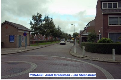
PUNAISE: Jozef Israëlslaan - Jan Steenstraat