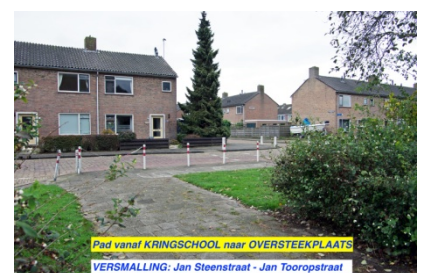
Pad vanaf KRINGSCHOOL naar OVERSTEEKPLAATS VERSMALLING: Jan Steenstraat - Jan Tooropstraat