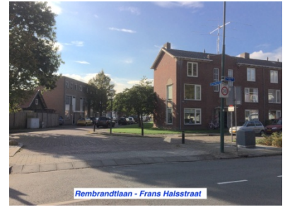
Rembrandtlaan - Frans Halsstraat