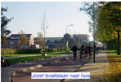
Jozef Israëlslaan naar huis