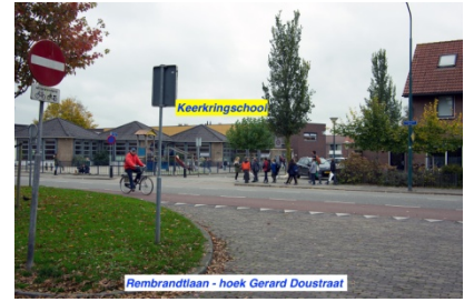
Rembrandtlaan - hoek Gerard Doustraat