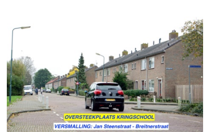
OVERSTEEKPLAATS KRINGSCHOOL VERSMALLING: Jan Steenstraat - Breiherstraat