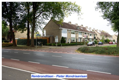
Rembrandtlaan - Pieter Mondriaanlaan