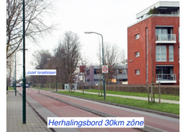
Herhalingsbord 30km zone