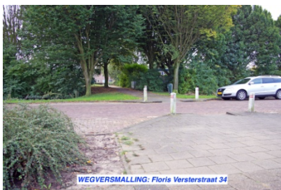
WEGVERSMALLING: Floris Versterstraat 34