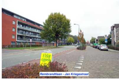
Rembrandtlaan - Jan Kriegestraat