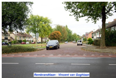
Rembrandtlaan - Vincent van Goghlaan