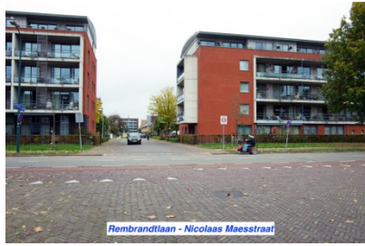
Rembrandtlaan - Nicolaas Maesstraat