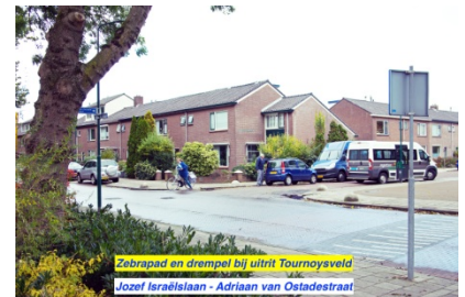
Zebraap en drempel bij ultritt Tournoyveld Jozef Israëlslaan - Adriaan van Oostdijkstraat