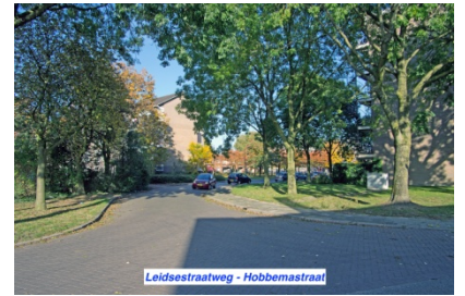
Leidsestraatweg - Hobbemastraat