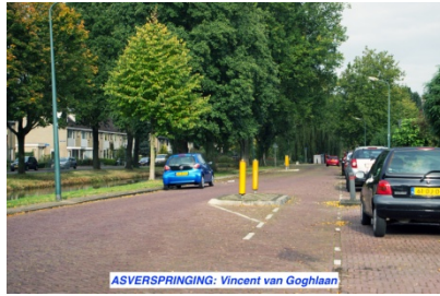
ASVERSPRINGING: Vincent van Goghlaan