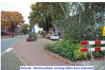
Rotonde - Rembrandtlaan ventweg (30km bord ontbreekt)