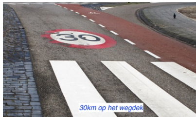
30km op het wegdek