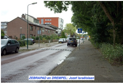
ZEBRAPAD en DREMPEL: Jozef Israëlslaan