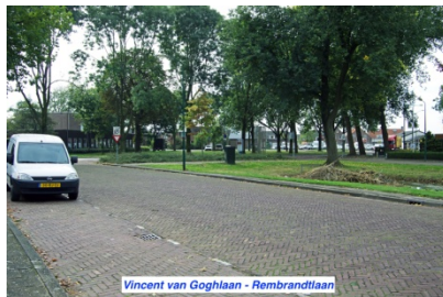
Vincent van Goghlaan - Rembrandtlaan