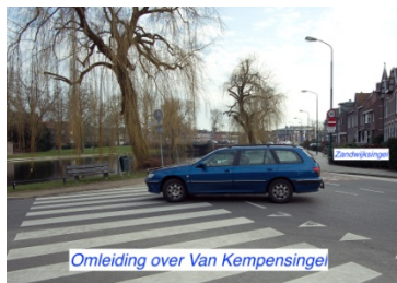
Omleiding over Van Kempensingel