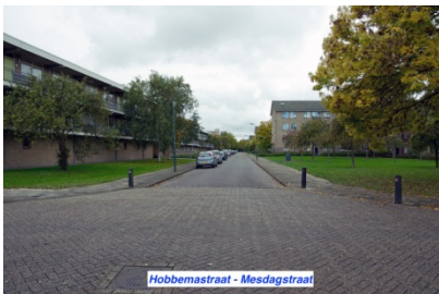
Hobbemastraat - Mesdagstraat