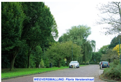
WEGVERSMALLING: Floris Versterstraat