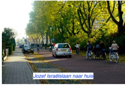
Jozef Israëlslaan naar huis