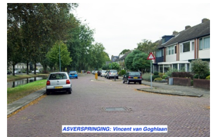
ASVERSPRINGING: Vincent van Goghlaan