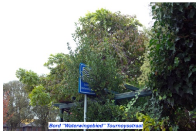
Bord "Waterwingebied" Tournoystraat