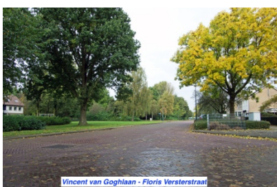
Vincent van Goghlaan - Floris Versterstraat