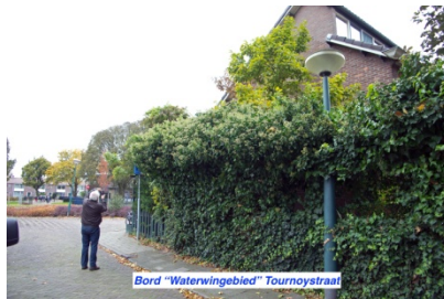
Bord "Waterwingebied" Tournoystraat