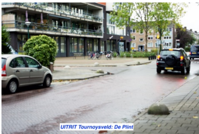
UITRIT Tournoyveld: De Pijl