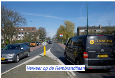
Verkeer op de Rembrandtlaan