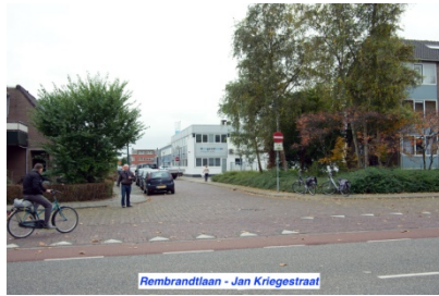
Rembrandtlaan - Jan Kriegestraat