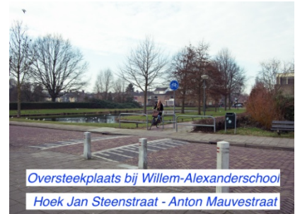
Oversteekplaats bij Willem-Alexanderschool