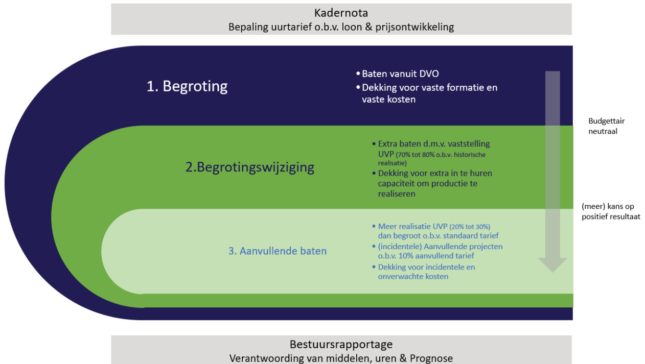
FIGUUR 2: BEGROTINGSMETHODIEK BIJ DE ODRU

Figuur 2 geeft de systematiek van begroten grafisch weer.