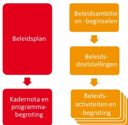
Figuur 2: samenhang beleidscyclus en planning- en controlcyclus

Begrotingswijzigingen die effect hebben op de hoogte van de gemeentelijke bijdragen worden altijd voor een zienswijze voorgelegd aan de gemeenteraden. De gemeenten worden op deze manier in de gelegenheid gebracht om zowel invloed uit te oefenen op de strategische koers van de VRU die wordt beschreven in het beleidsplan als de concrete uitwerking en financiële vertaling daarvan in de programmabegroting.