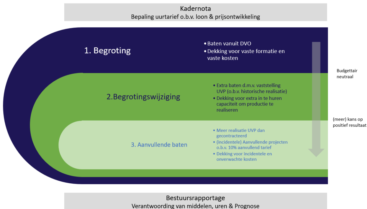
FIGUUR 2: BEGROTINGSMETHODIEK BIJ DE ODRU

Figuur 2 geeft de systematiek van begroten grafisch weer.