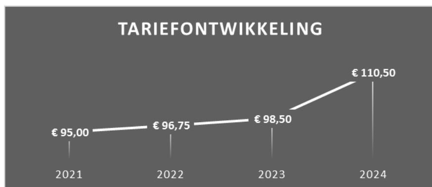
FIGUUR 3: TARIEFONTWIKKELING 2021 - 2024

Onderstaande figuur geeft weer wat de tariefontwikkeling is ten opzichte van de afgelopen jaren: