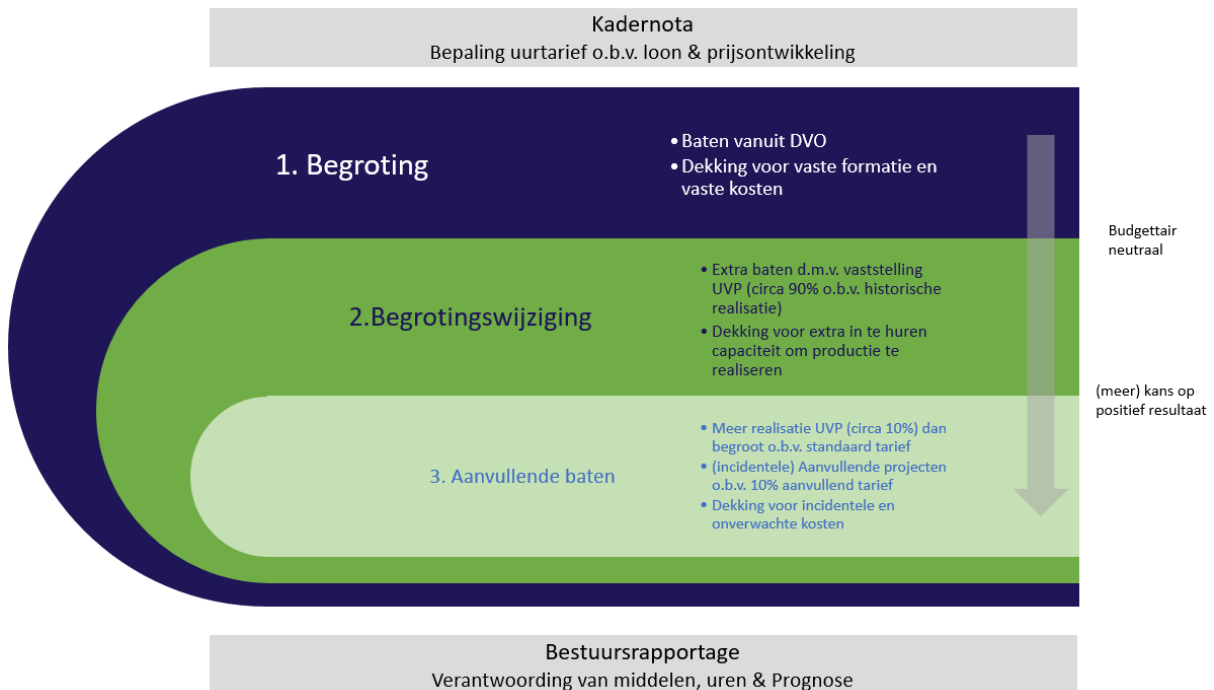
FIGUUR 2: BEGROTINGSMETHODIEK BIJ DE ODRU

Figuur 2 geeft de systematiek van begroten grafisch weer.