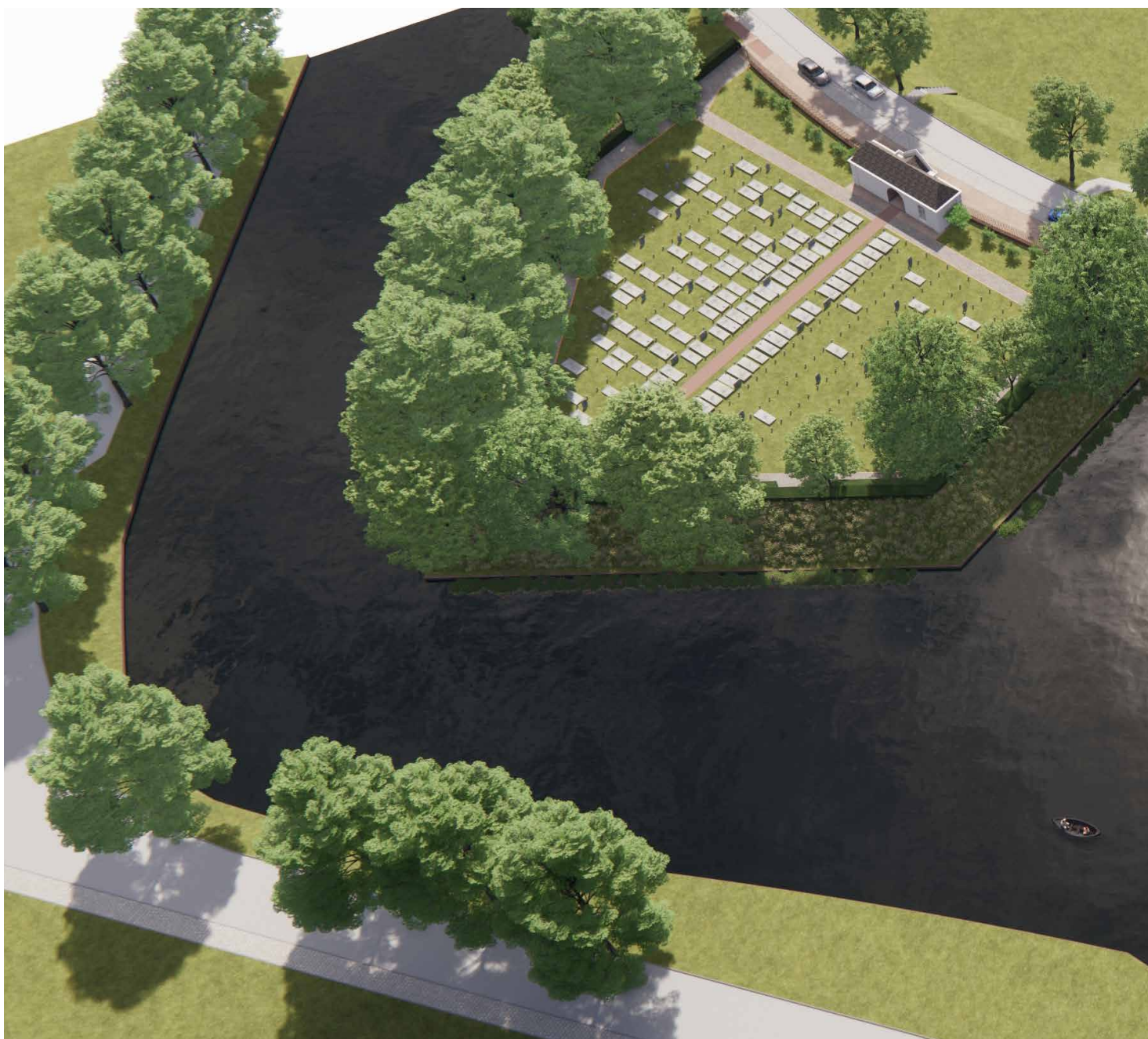
Toekomstig beeld in vogelvlucht