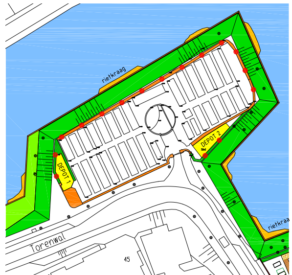
Nieuwe situatie Torenwal