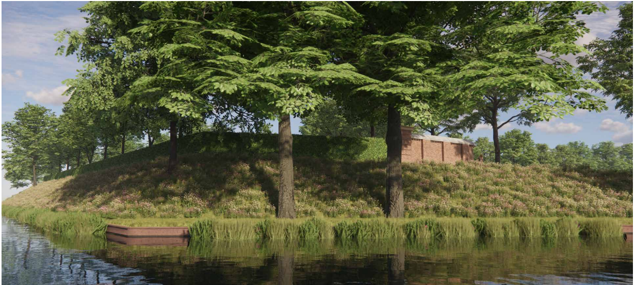
Toekomstig beeld Torenwal

komen ook bomen, bestaande waar dit past en nieuwe waar ruimte ontstaat.