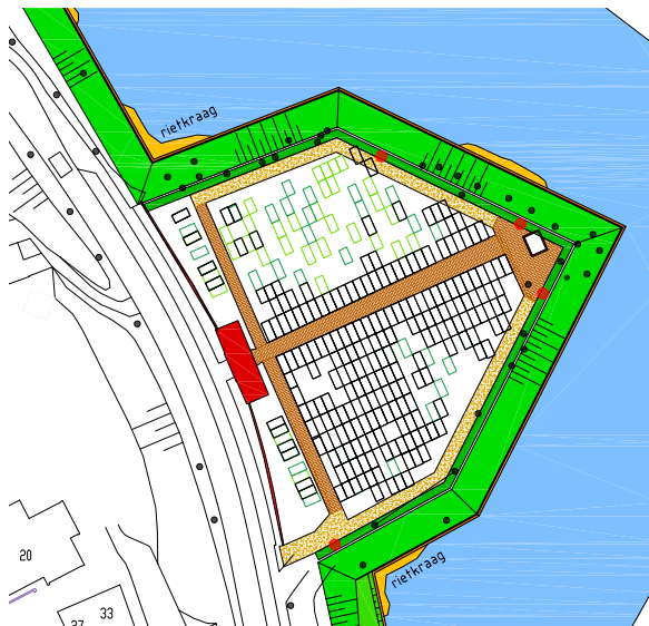
Nieuwe situatie Hogewal