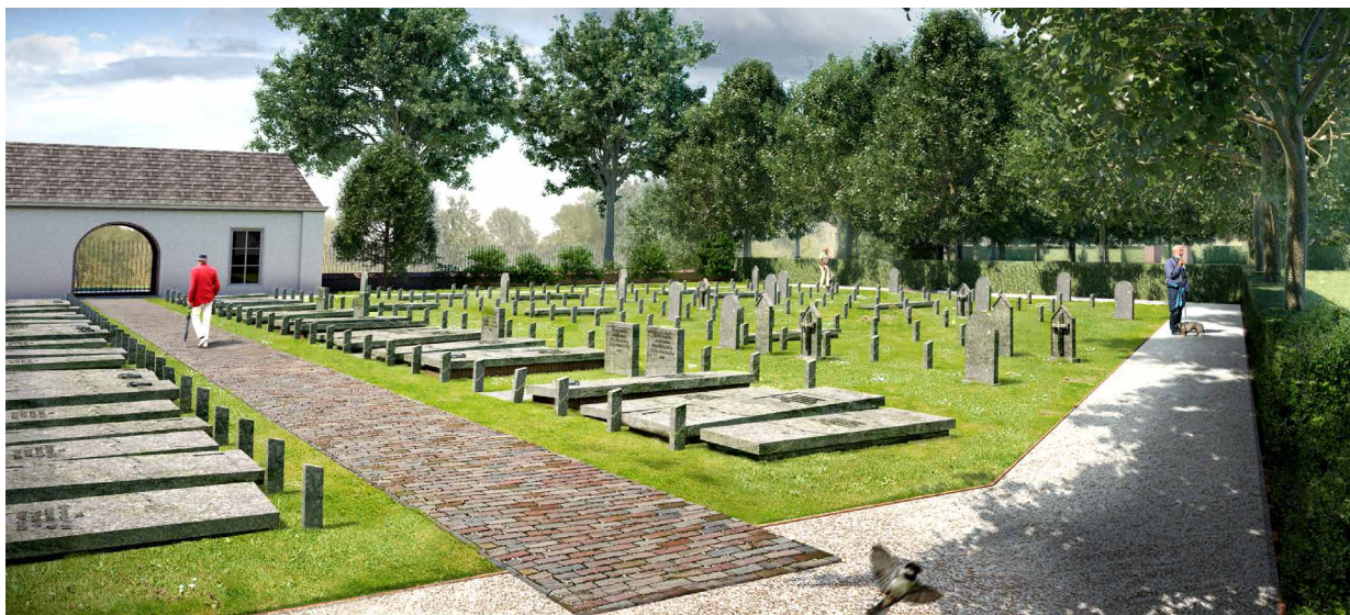
Toekomstig beeld begraafplaats Hogewal