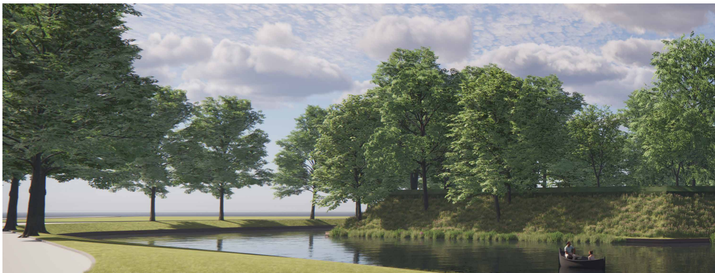
Toekomstig beeld Hoge wal