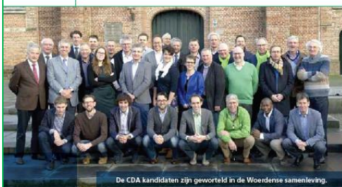
De CDA kandidaten zijn geworteld in de Woerdense samenleving.