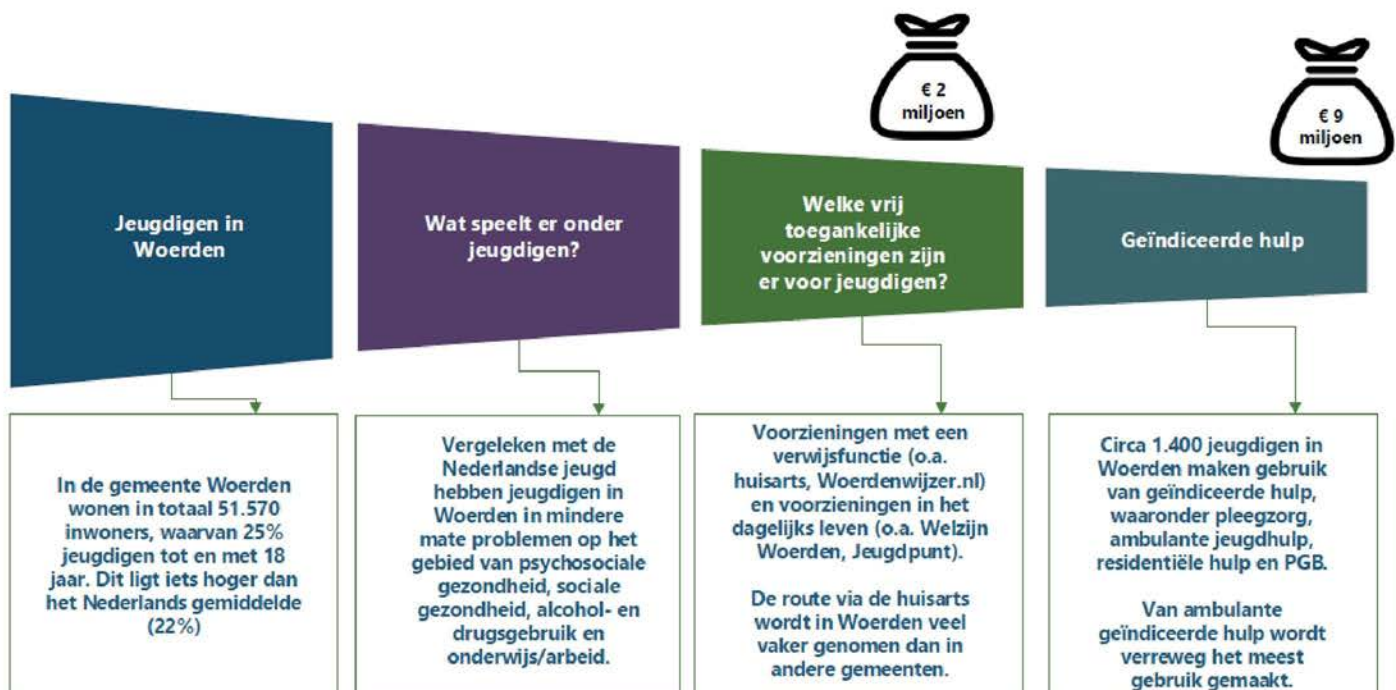
Figuur 1 Schematische weergave van jeugdzorg in Woerden

De schematische weergave is hieronder te vinden. De toelichting op de verschillende blokken is in de daaropvolgende paragrafen beschreven.