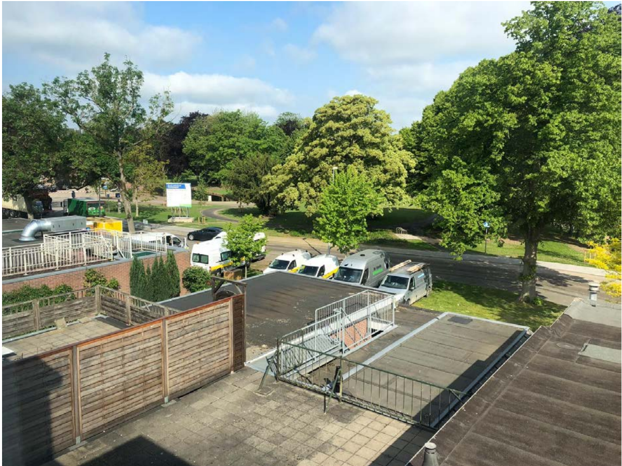
1. Foto parkeren groenstrook