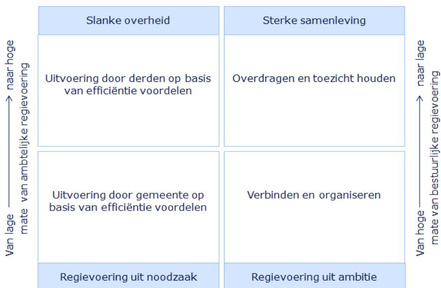
Regievoering uit noodzaak en ambitie

Voor het toepassen van het begrip “regievoering” hanteren we het volgende schema: