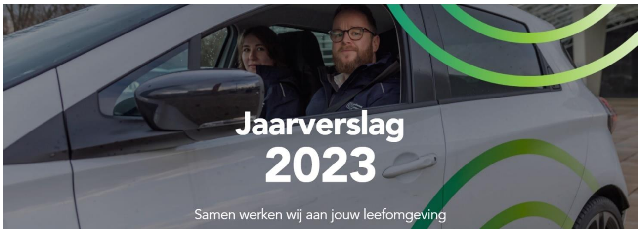
Figuur 1 - https://odru2023.jaarverslag.org/

In het jaarverslag wordt verantwoording afgelegd over de realisatie van de vooraf gestelde doelen zoals opgenomen in de begroting 2023. Wij zijn trots op onze inhoudelijke resultaten en willen u daarom een korte terugblik geven op 2023. U kunt het jaarverslag bekijken door op onderstaande afbeelding te klikken.