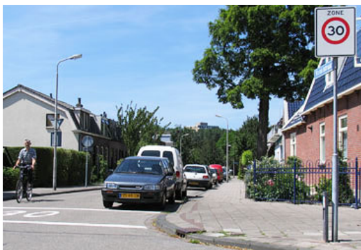
Voorbeeld van een poortconstructie met 30km/ zone aanduiding met bord en op het wegdek

Onderstaande wegen voldoen aan het wegcategoriseringsplan. Wel gaan wij de poortconstructie (het begin/ eind van de 30 km/ zone) anders laten situeren en vormgeven, voor een hogere attentiewaarde. Zie de foto als een voorbeeld van een dergelijke poortconstructie.