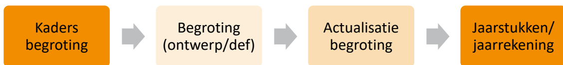
Figuur 1: proces begroting en verantwoording VRU

De gemeenten worden in de gelegenheid gesteld om hun zienswijze over de algemene financiële en beleidsmatige kaders te geven. De zienswijzen betrekken we bij het opstellen van de begroting van 2025 en de geactualiseerde begroting 2024. Voordat het bestuur de begroting 2024 definitief vaststelt, wordt deze ook voor zienswijzen aan de gemeenten aangeboden. De gemeenten hebben op deze manier twee gelegenheden om invloed uit te oefenen op de begroting van de VRU.