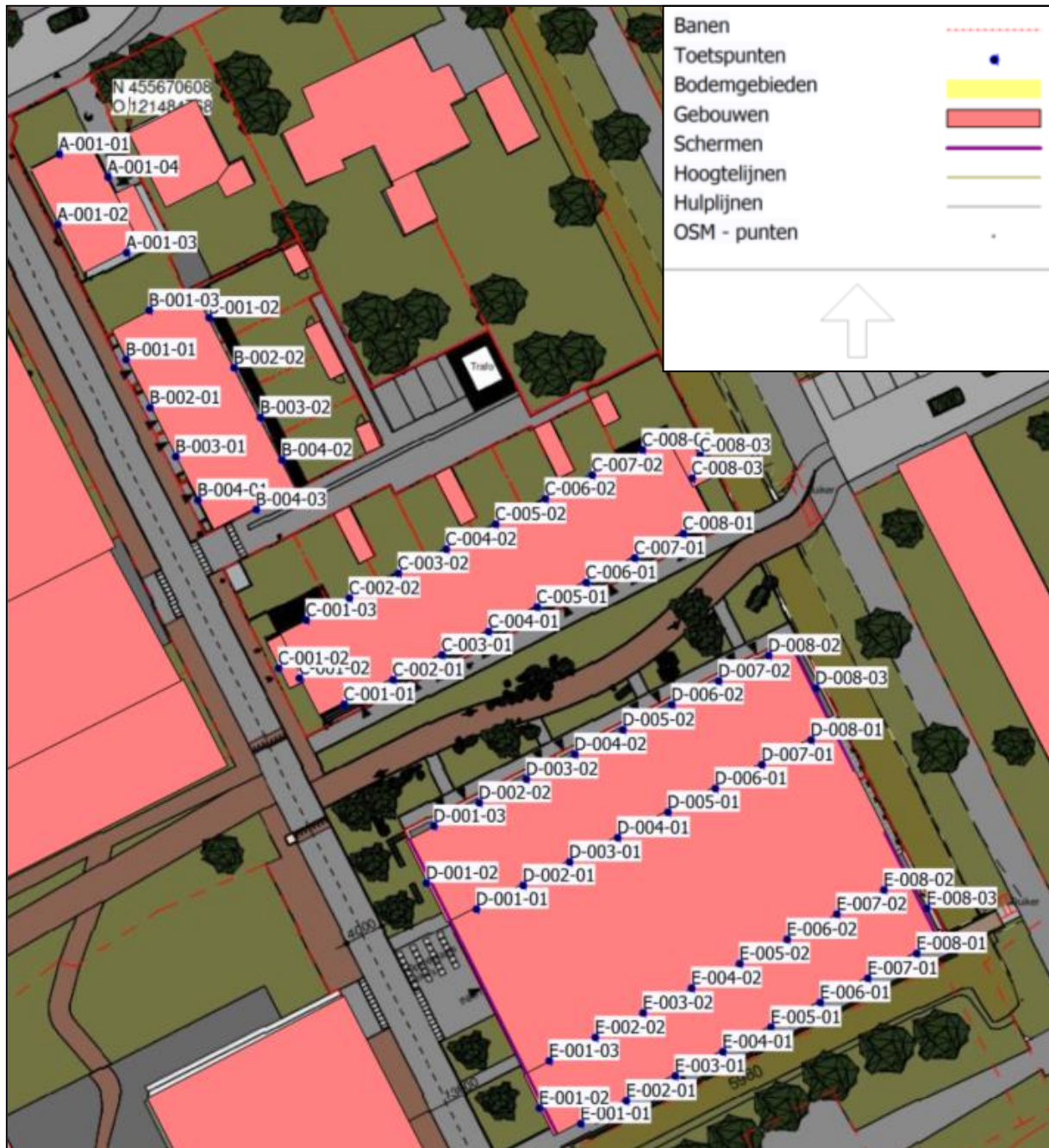
Figuur 3: Overzicht rekenpunten