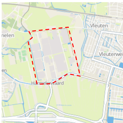
Afbeelding 1: uitsnede van de polder Harmelerwaard, scope verkenningsstudie

Om perspectief te bieden aan ondernemers en andere belanghebbenden in de Harmelerwaard is in een collegebesluit van 20 april 2021 ingestemd met het uitvoeren van een verkenningsstudie. De vereniging Harmelerwaard 3.0 is in dit vraagstuk de initiatiefnemer geweest, maar nu is de overheid aan zet als trekker van de verkenningsstudie. De overheid is niet verantwoordelijk voor de individuele bedrijfsvoering maar wel voor de ruimtelijke kaders. De gemeente bepaalt, in samenwerking met hogere overheden, welke ruimtelijke kaders en regels op een gebied van toepassing zijn. Met deze verkenning vormen de gemeente en de provincie Utrecht gezamenlijk een beeld van de toekomstmogelijkheden voor het gebied waarin ook breed gekeken wordt naar de verschillende (lokale en regionale) belangen die spelen in het gebied.