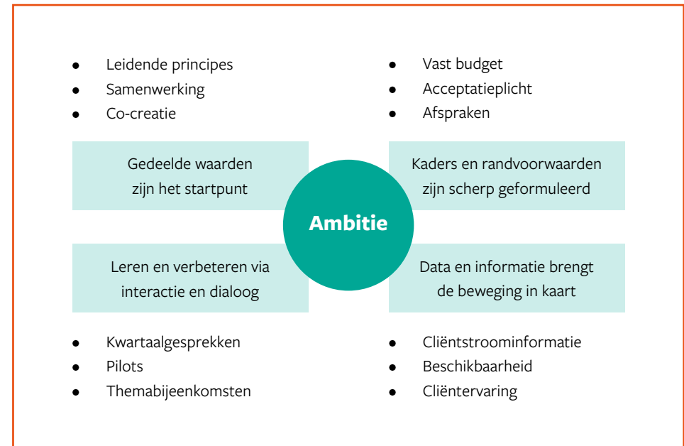
FIGUUR 2: HET UTRECHTSE MODEL

We doen dit als 16 gemeenten samen en betrekken cliënten, toegangspartijen en aanbieders hierbij. Ook zoeken we verbinding met andere partners, zoals woningcorporaties